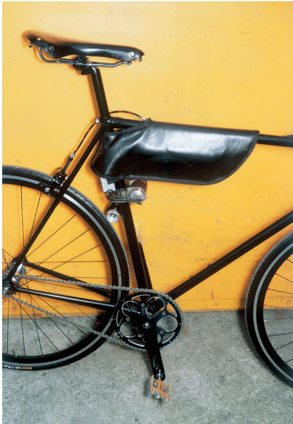
^EL Primo zeigt, wie aus einem normalen Stadtvelo ein puristisches E-Bike wird, das seine Kraftreserven züchtig verhüllt.