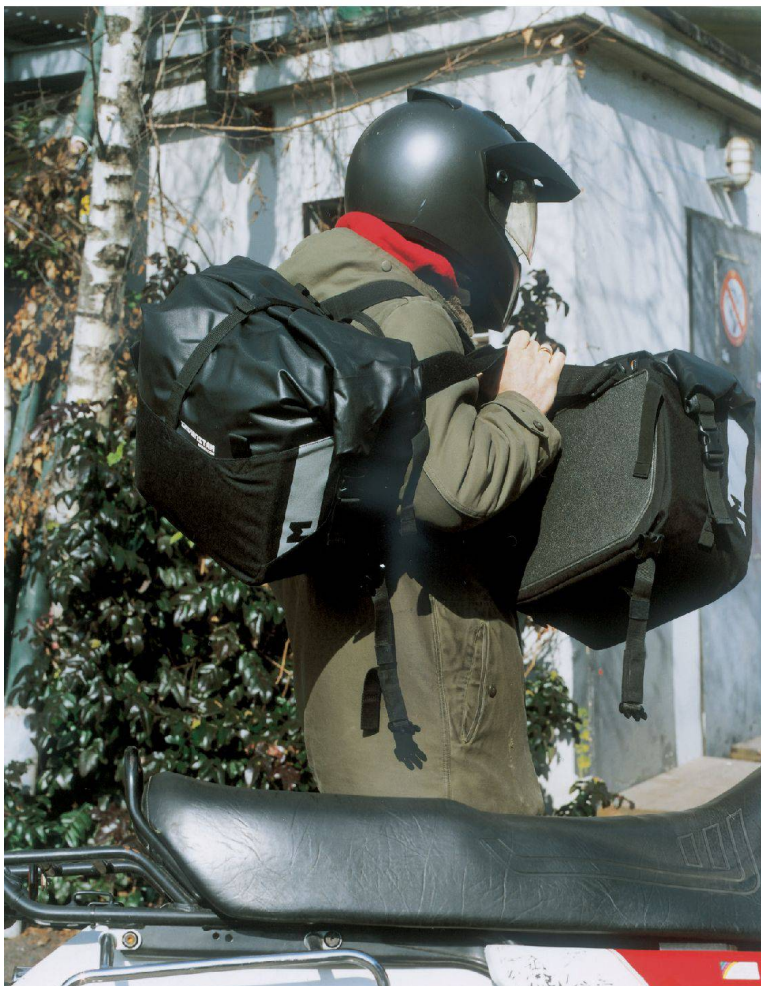
<Robust, praktisch – und sieht auch so aus. Die Satteltasche für den Motorrad-Cowboy.