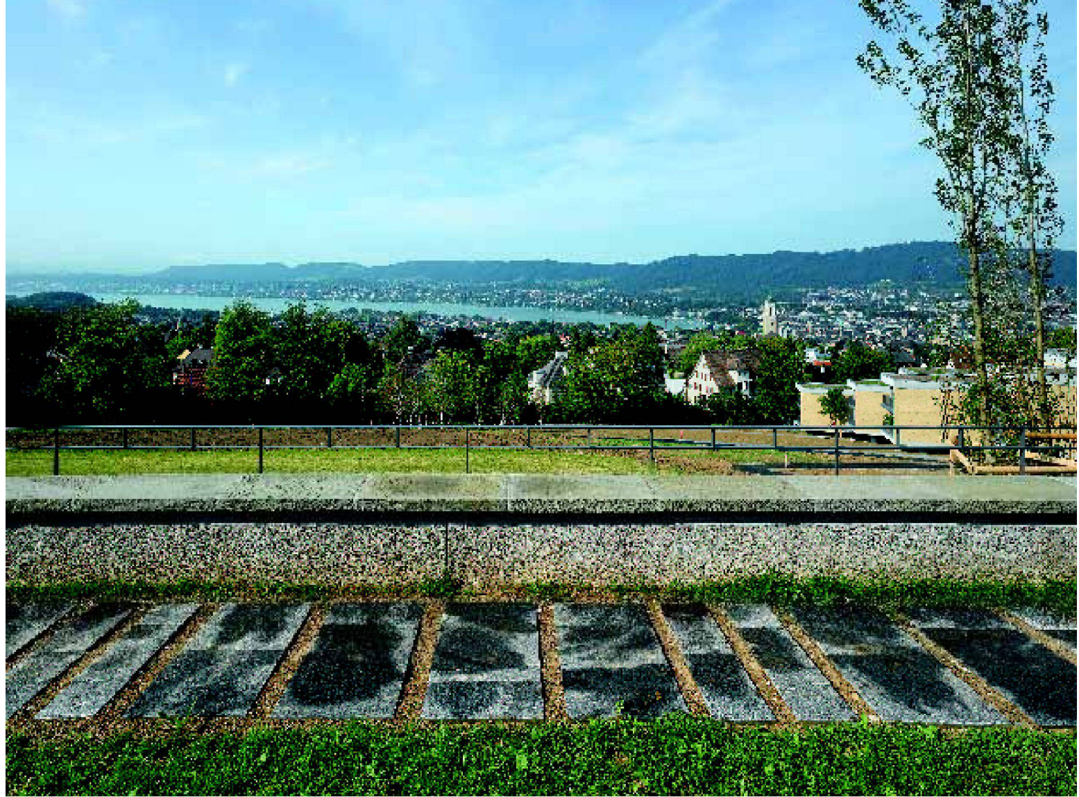
^Trotz Neubebauung bleibt der Blick auf ein atemberaubendes Panorama frei.