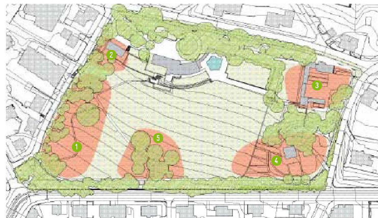
↑ Ursprüngliche Situation: Die Landschaftsarchitekten Schweingruber Zulauf definierten fünf Baufelder. Drei wurden in einer ersten Etappe überbaut.