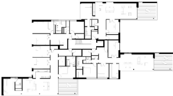
^Grundriss 2. Obergeschoss

>Der geschwungene Altbau thront über der Wiese und fängt die einmalige Aussicht ein.