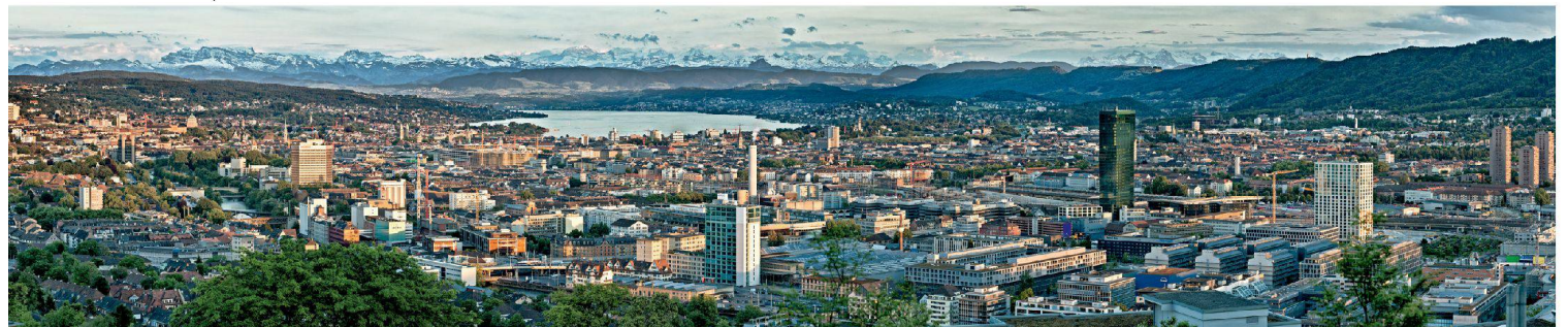
∨Das Stadtpanorama von Zürich im Jahr 2011.