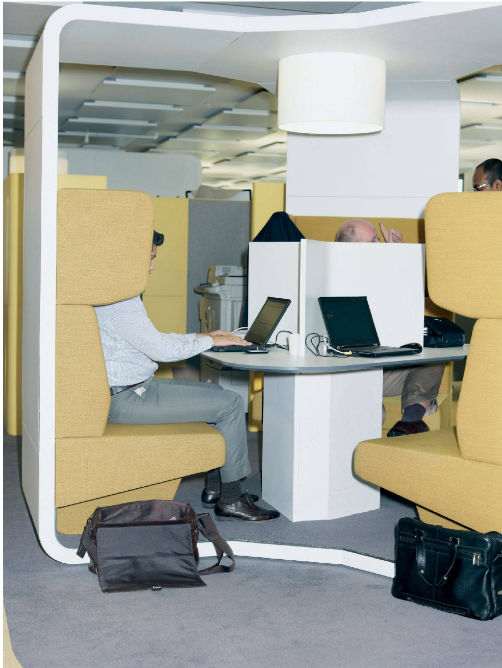
^Der «Touchdown» von Lista Office, wo man sich nur kurz hinsetzt und Mails checkt, versucht einen Raum im Raum zu schaffen.