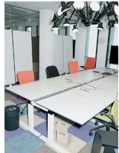
✓ Die Projekträume werden von wechselnden Teams genutzt.