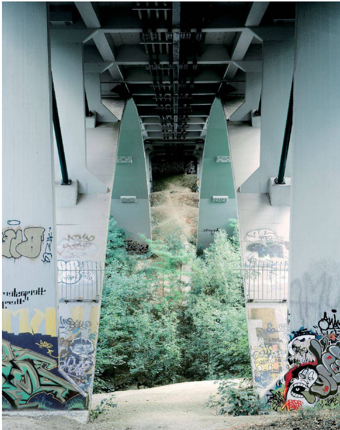
^Die Brücke über den Aire in Grand-Lancy.