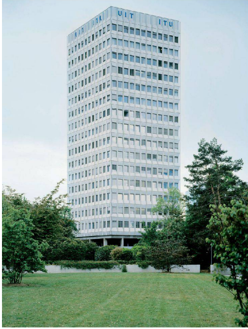
<Ein Hochhaus auf fünfeckigem Grundriss: der Sitz der Internationalen Organisation für Telekommunikation (ITU).