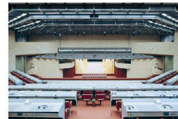
^17_Centre International de Conférences de Genève.