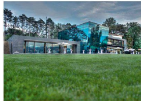
>11_Erweiterungsbau World Economic Forum.