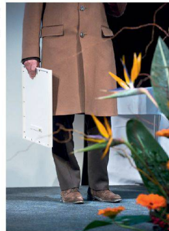
>Stilleben mit Urkunde, Lammfellmantel und Papageienschnäbel.