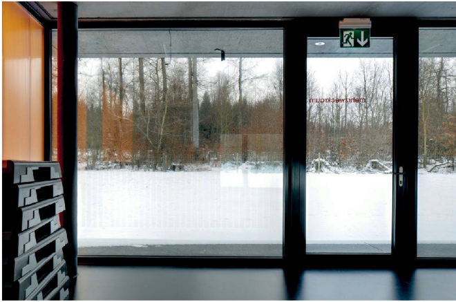
^Vogelschutzscheiben eingesetzt: Sporthalle am Waldrand in Sursee.