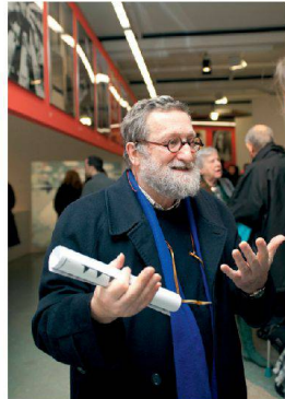
✓Gehört zu den junggebliebenen Altmeistern: Bruno Monguzzi.