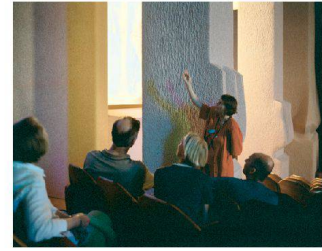
«Achim Hatzius, «Nach Atlantis».