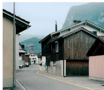
«Susanne Stauss, «Verborgen, vertraut. Architektur im Kanton Glarus».