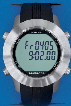
<So sieht der Tauchcomputer als Armbanduhr aus, bevor er in die Tiefe sinkt.