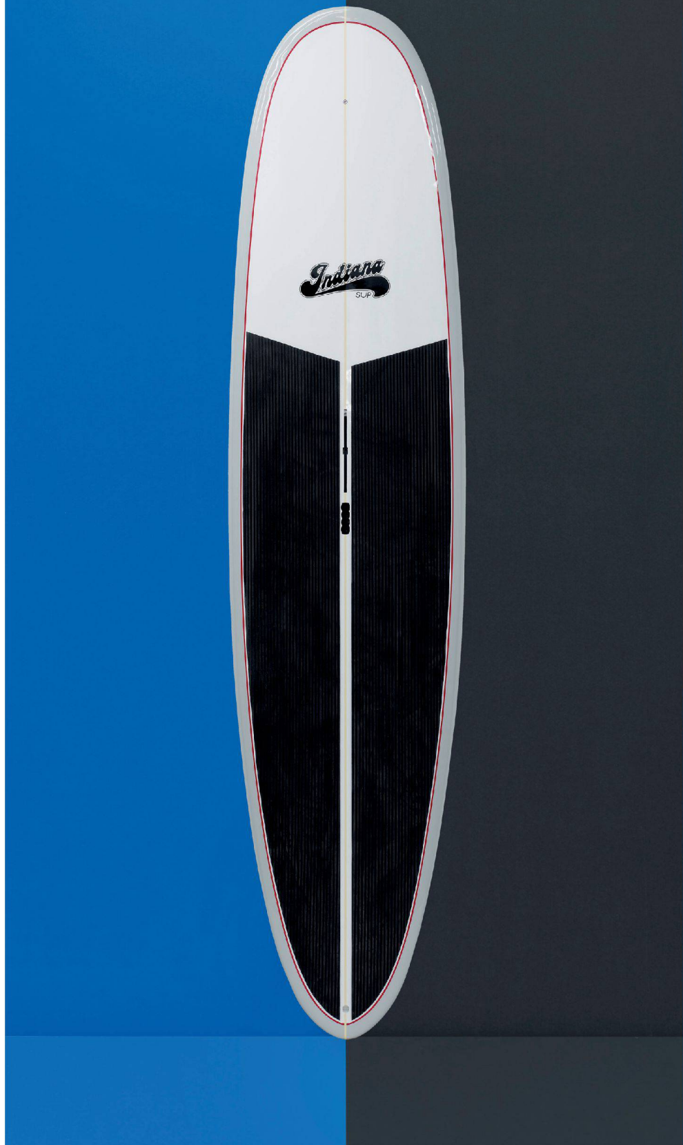
^«Aloha Hawaii» auf dem Zürichsee: auch wenn die Wellen fehlen.