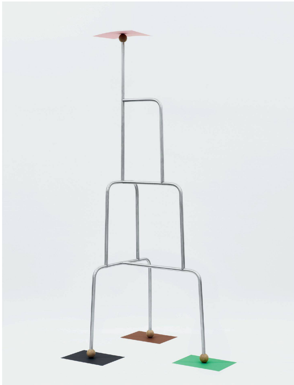
^«Der Bremer» hilft mit, Waschpulver zu sparen. Weil man Kleider auch lüften kann.