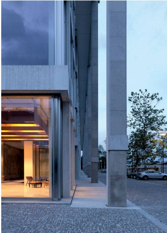
18 __ Kolossale Pfeiler: Synthes-Neubau in Solothurn von Peter Märkli.