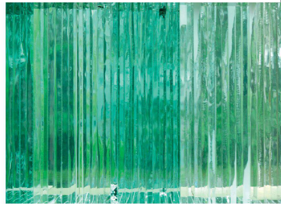
◀ 1:1 Muster aus geschichteten Glasscheiben.