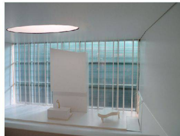
◀ Die Neuapostolische Kirche in Zürich-Albisrieden mit 35 Wohnungen soll 2014 fertiggestellt werden.