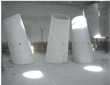
^Dach und Deckenuntersicht der Reformierten Kirche in Dornach sind unterschiedlich gefaltet – die Zylinder der Oberlichter entsprechend unterschiedlich lang.