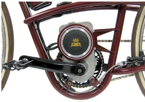
◁ Auch ein E-Bike kann mit nostalgischem Hauch daherradeln.