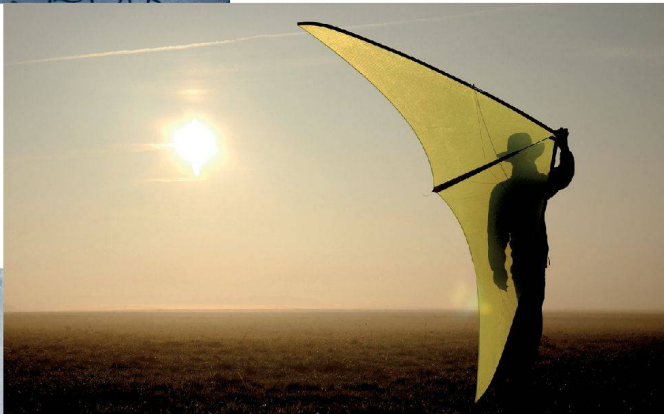
^ Die Drachen von Thomas Kiss Horváth fliegen auch ohne Wind.