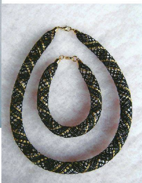
◁ Die beiden Textildesignerinnen Brigitte Bättig und Lara Bulla verwenden Altes und schaffen Neues.