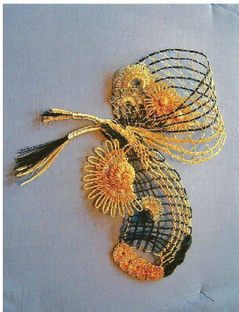
∨ Inspiriert an alten Sticktechniken und -mustern.