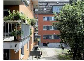
^4_Siedlung Scheuchzerhof Scheuchzerstrasse 186-198, 8057 Zürich Bauherrschaft: Baugenossen- schaft Oberstrass; Architektur: Team 4 Architekten, Zürich; Seite 20