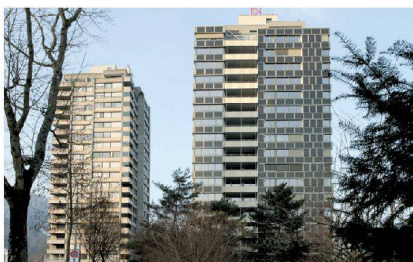
<12_Wohnhochhäuser Sihlweid Sihlweidstrasse 1, 8041 Zürich Bauherrschaft: Baugenossenschaft Zür Linden; Architektur: Harder Haas Partner, Eglisau; Seite 26