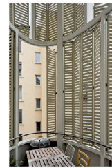
<6_Wohnhaus Hohlstrasse Hohlstrasse 9, 8004 Zürich Bauherrschaft: Stiftung PWG; Architektur: Joos & Mathys, Zürich