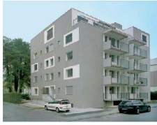
<19_Wohnhaus Bristenstrasse Bristenstrasse 27, 8048 Zürich Bauherrschaft: Swiss- invest Immobilien; Architektur: Forster & Uhl, Zürich