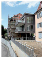
<11_Siedlung Mutschellenstrasse Mutschellenstrasse 52-64, 8038 Zürich Bauherrschaft: Baugenos- senschaft Zürich 2; Architektur: GLP PAN Archi- tekten, Zürich