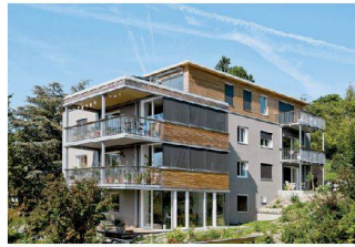
<2_Wohnhaus Segantinistrasse Segantinistrasse 200, 8049 Zürich Bauherrschaft: Peter, Sara und Markus Rieben; Architektur: Kämpfen für Architektur, Zürich; Seite 16