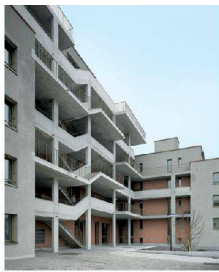
<1_Siedlung «Kraftwerk2» Regensdorferstrasse 190/194, 8049 Zürich Bauherrschaft: Bau- und Wohngenossenschaft «Kraftwerk1»; Architektur: Adrian Streich, Zürich; Seite 28