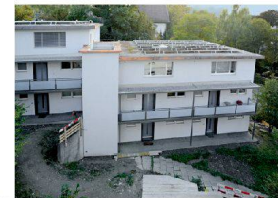
^9_Wohnhaus Billrothstrasse Billrothstrasse 14, 8008 Zürich Bauherrschaft: Johannes Steiner; Architektur: Stöckli, Grenacher, Schäubli, Zürich; Seite 30