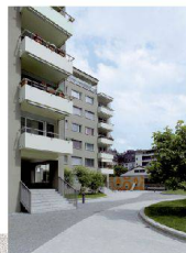
<15_Siedlung S01 Wiedikon Goldbrunnenstrasse/ Gertrudstrasse/Halden- strasse, 8003 Zürich Bauherrschaft: Allgemeine Baugenossenschaft Zürich; Architektur: Arge Met Architektur & WSS, Zürich