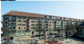
^17_Siedlung Sihlfeld Ernastrasse/Sihlfeldstrasse/ Zypressenstrasse, 8004 Zürich Bauherrschaft: Allgemeine Baugenossenschaft Zürich; Architektur: Schaffner Architekten, Zürich; Seite 22