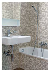
^14_Wohnhaus Bühlstrasse Bühlstrasse 39/41, 8055 Zürich Bauherrschaft: Stiftung PWG; Architektur: Vollenweider Baurealisation, Zürich