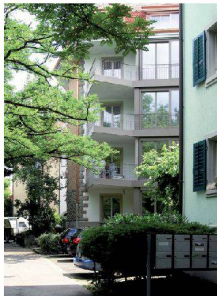
>16_Wohnhaus Bertastrasse Bertastrasse 72, 8003 Zürich Bauherrschaft: Miteigentümer- schaft Mijnsen; Architektur: Huggenbergerfries, Zürich; Seite 18