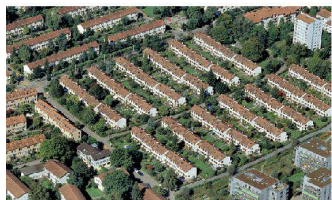
^13_Siedlung Arbestal Arbestalstrasse 121-280, 8045 Zürich Bauherrschaft: Familienheim Genossenschaft Zürich FGZ; Architektur: Hopf & Wirth, Winterthur; Seite 31