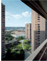
<18_Siedlung Hardau II Bullingerstrasse/ Norastrasse, 8004 Zürich Bauherrschaft: Amt für Hochbauten der Stadt Zürich; Architektur: Batimo, Zofingen