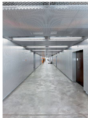
<Der Klassenzimmergang treibt die Länge des Gebäudes auf die Spitze.

Berufsfachschule, Freiburg HART, ABER WEICH