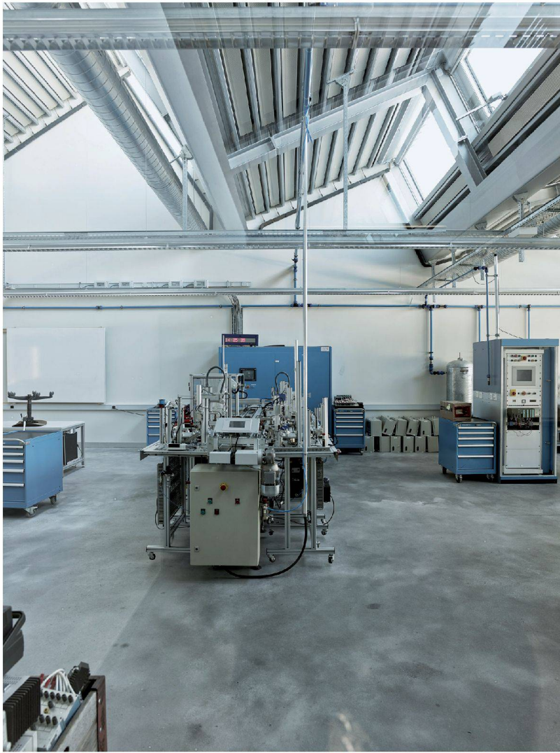
^In den Werkstätten liegt die Konstruktion der Sheddächer offen.