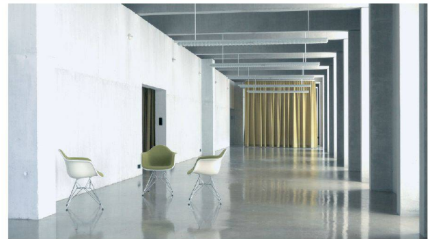
^ Im Innern überrascht das Bürohaus mit legerer Weite.