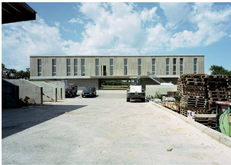
^ Unten das Material, oben das Gebäude: Werkhof in Oberhasli.

> Baukosten (BKP 2/m 2 nach SIA 416): CHF 655.-