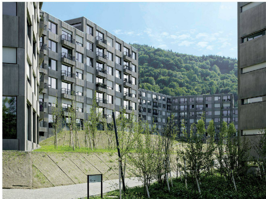
^ Ein grosser Hof am Fusse des Zürcher Hausbergs.