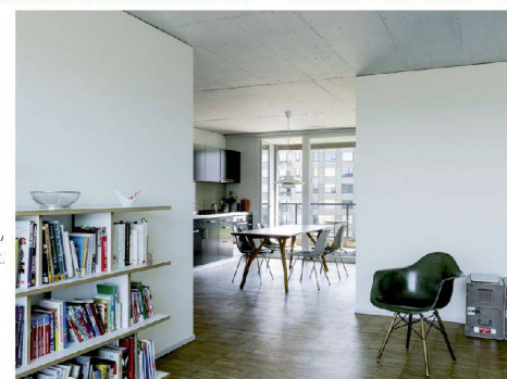
> Die Wohnungen sind robust, variabel und gut proportioniert.