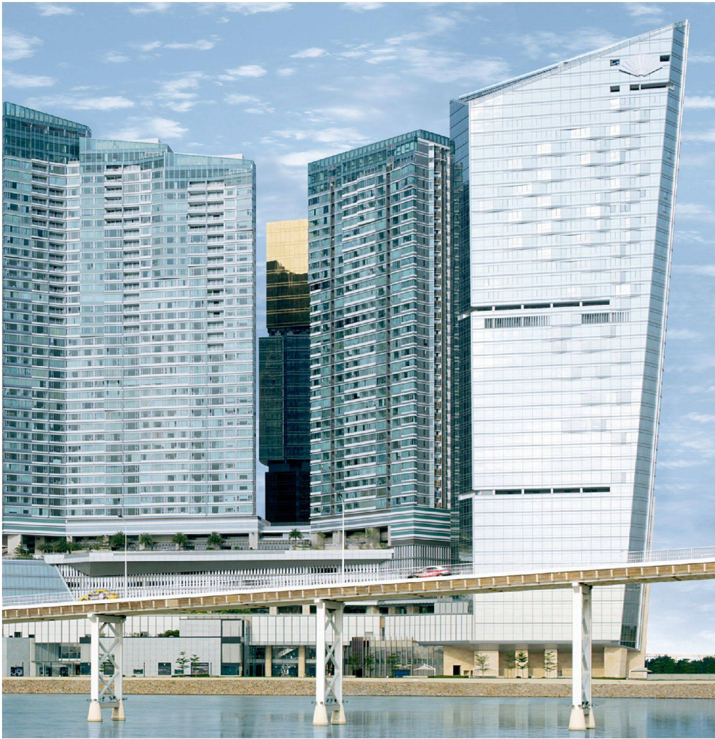
One Central, Macau