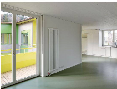
44 __ Wohnen in geknickten Räumen.