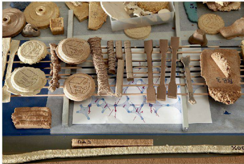
36 __ Ein natürlicher Kunststoff entsteht.