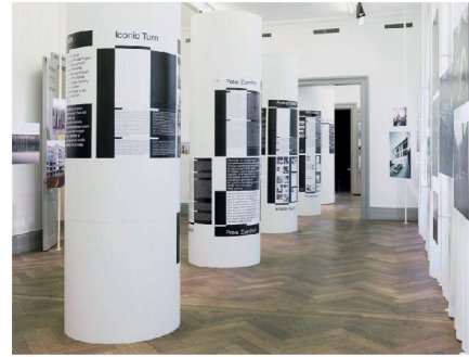
← Schweizerisches Architekturmuseum Basel: «Bildbau. Schweizer Architektur im Fokus der Fotografie».