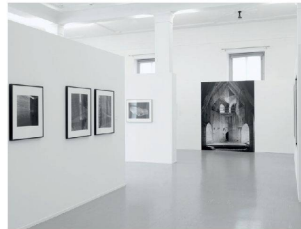
← Kunstmuseum Chur: «Ansichtssache. 150 Jahre Architektur fotografie in Graubünden».