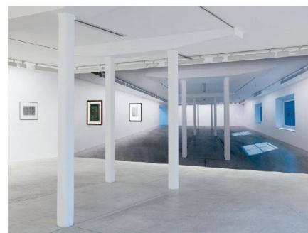
← Fotomuseum Winterthur: «Concrete. Fotografie und Architektur».