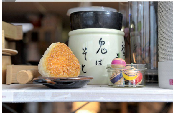
^In den Regalen und auf den Ablagen gab es einiges zu entdecken: vom Plastik-Sushi bis hin zu Origami-Pommes.