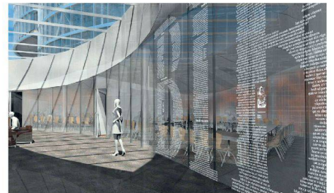
✓Projet de signalétique, Maison de la Paix, Genève, sous la direction de Ruedi Baur, 2013.