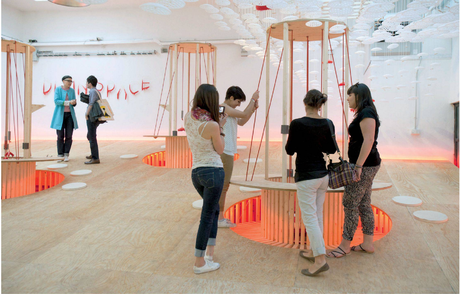
^«Dip in Space», exposition réalisée par les étudiants du MA Espaces et Communication et du BA Architecture d'Intérieur, sous la direction de Matali Crasset, à l'occasion du Salon International du Meuble de Milan 2011.