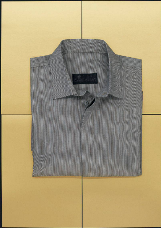
^Das Hemd «Laveran» ist ohne Taschen und lehrt «weniger ist mehr».