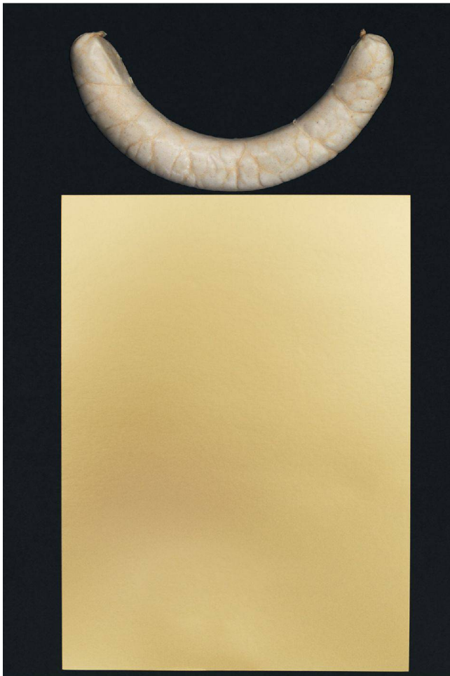
<An der Wurst lässt sich zeigen, wie Design zu kritisieren ist.