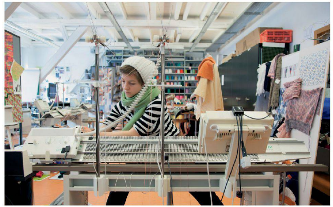
Entwerfen im Textildesign lernt man in der Werkstatt.