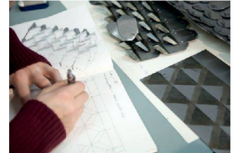
Digital Crafting erkundet digitale Entwurfs- und Produktionsprozesse.