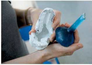
Aus der Form gehoben: das Objekt.