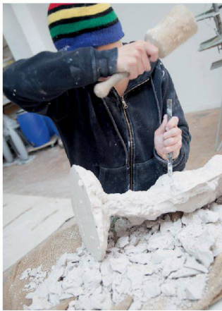
Material bearbeiten heisst Widerstände überwinden.