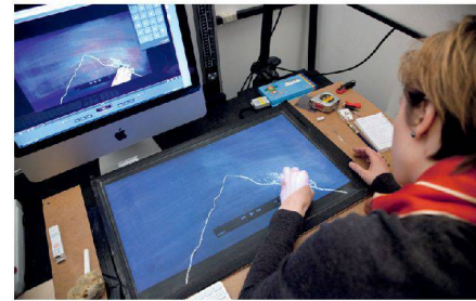
Der Computer, ein Werkzeug wie andere auch, will beherrscht sein.