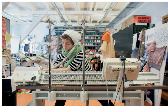
Entwerfen im Textildesign lernt man in der Werkstatt.