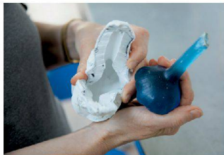
Aus der Form gehoben: das Objekt.