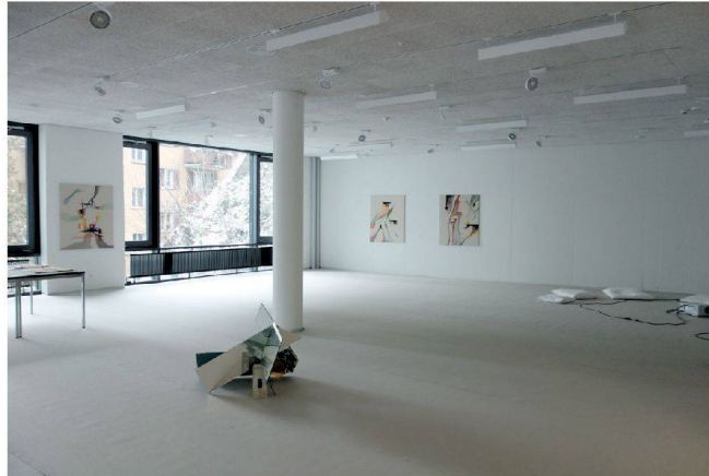
Baselstrasse 61 in Luzern: Noch sind die neuen Räume fast leer.