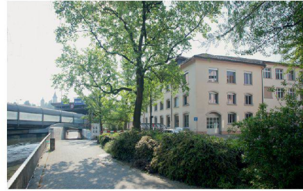
Die Sentimatt beherbergte einst die Schindler-Liftfabrik.

Arbeitsplätze für Textildesignerinnen und Textildesigner entstehen, die in Luzern ausgebildet wurden. Internationalisierung ist kein Schlagwort, sondern pure Notwendigkeit. «Wir müssen unsere Studentinnen und Studenten für den internationalen Markt fit machen. Die Textilindustrie ist heute in China, Indien, Brasilien.» Oder in Afrika, wie das aktuelle Projekt «Ankara, Air Condition & Co.» beweist.