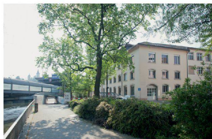
Die Sentimatt beherbergte einst die Schindler-Liftfabrik.

Arbeitsplätze für Textildesignerinnen und Textildesigner entstehen, die in Luzern ausgebildet wurden. Internationalisierung ist kein Schlagwort, sondern pure Notwendigkeit. «Wir müssen unsere Studentinnen und Studenten für den internationalen Markt fit machen. Die Textilindustrie ist heute in China, Indien, Brasilien.» Oder in Afrika, wie das aktuelle Projekt «Ankara, Air Condition & Co.» beweist.