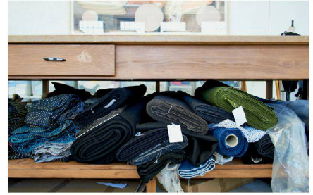
PortenierRoth agiert autonom, ist nicht auf Mindestbestellmengen angewiesen und braucht keine grossen Lagerbestände.