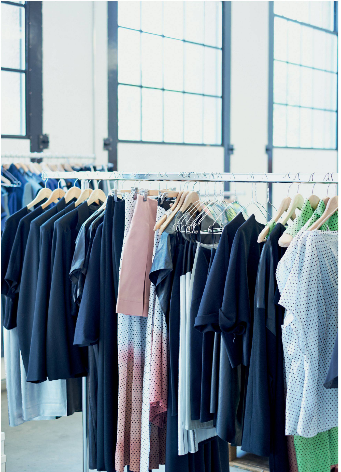
PortenierRoth kombiniert Leder, Seide, Strick. Treffen unterschiedliche Textilien aufeinander, müssen die Stiche und die Garne bei jeder Naht angepasst werden.