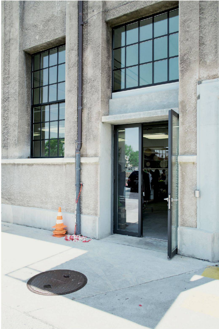
Die Manufaktur an der Scheibenstrasse in Thun, in einer ehemaligen Metallgiesserei.

→ Designerinnen über vier Jahre einen kleinen Maschinenpark aufgebaut, mit Strick- und Nähmaschinen, Dampfstationen und einem Schneidetisch. Sie sind in einen grösseren Raum gezogen, haben von 40 auf 150 Quadratmeter erweitert. In einer Ecke färben Sabine Portenier und Evelyne Roth die Textilien selbst, erhitzen die Farbe in kleinen Töpfen auf mobilen Herdplatten: «So können wir schneller reagieren und garantieren, dieselben Farben auch noch in einem halben Jahr liefern zu können.» Sie sind nicht auf Mindestbestimmungen angewiesen und brauchen keine grossen Lagerbestände. Und: Es ist schwierig, einen Lieferanten zu ersetzen, der aus der eingespielten textilen Lieferkette herausbricht.