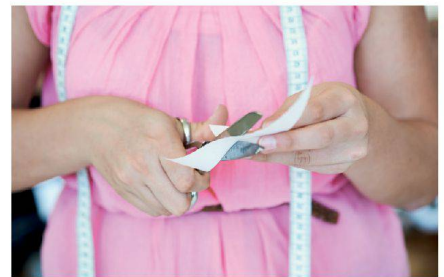
Die Designerinnen hinterfragen auch mal die gängigen Schneider-Standards und erneuern so die Schnitttechnik.