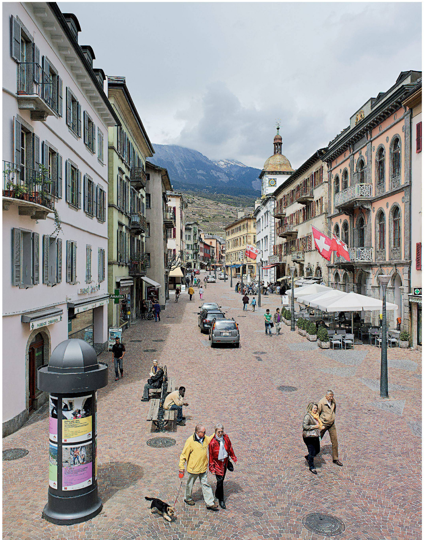
Rue du Grand-Pont: Pflastersteine von Fassade zu Fassade, die Autos fahren im Schritttempo.