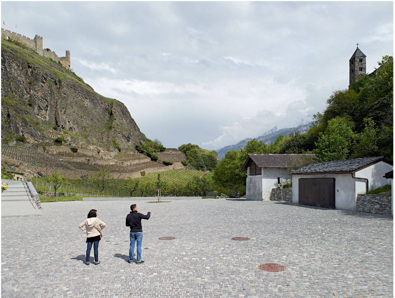
Place Maurice Zermatten: Eine lange Betonbank schliesst den Platz ab. Der Formenaufwand ist minimal.