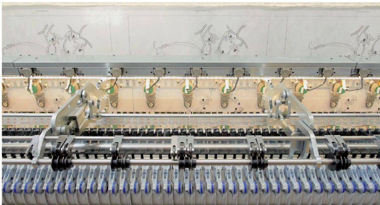
Stickmaschinen arbeiten mit bis zu 550 Nadeln. Wird das Ornament gestickt, steuert ein Computer die programmierten Koordinaten und bewegt den Stoff in die bestimmten Richtungen.