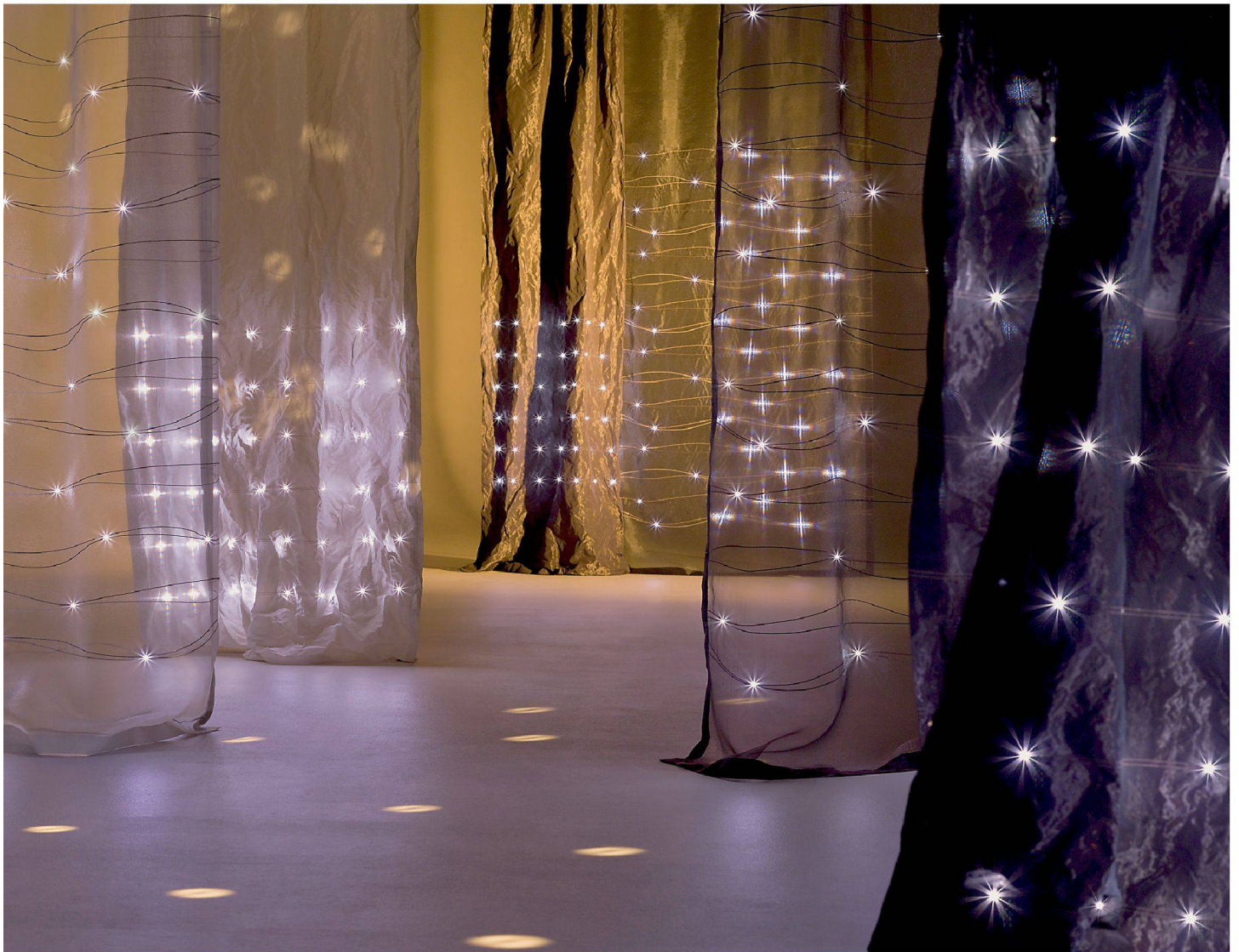
Es gibt die Leuchtstoffe «Aves» und «Sema» in irisierendem Weiss, metallischem Grau und einem rötlich schimmernden Braun. Das Licht ist dimmbar.