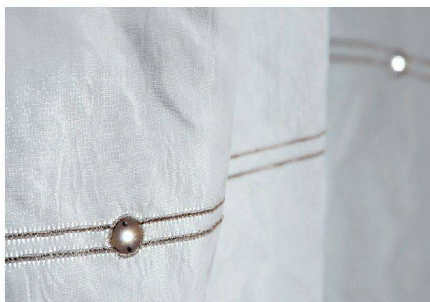
Wie glitzernde Pailletten sind die LEDs aufs Gewebe gestickt. Die zwei Leiterbahnen ergeben eine Doppellinie.

Am Designers' Saturday 2012 waren neue Versuche mit leuchtenden Stoffen zu sehen. Die Reaktionen des Publikums ermunterten die Langenthaler, diesen Herbst die Kollektion «Elumino» aufzulegen. Das E steht für Elektronik, Extravaganz und Exklusivität: Ein konfektionierter Vorhang von 1,3 mal 3 Meter kostet an die 2000 Franken. Fürs Leuchten sorgen nicht mehr Glasfasern, sondern 42 wie glitzernde Pailletten auf das transparente Gewebe gestickte LEDs.