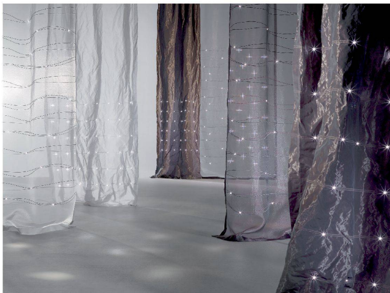
Die Kollektion «Elumino» umfasst zwei Qualitäten: Das blickdichte Metallgewebe «Aves», das sich skulptural verformen lässt, und das transparente «Sema», bei dem die Lichtpunkte je nach Blickwinkel in der Luft zu schweben scheinen.