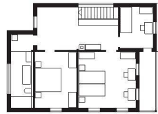
Obergeschoss | Upper floor