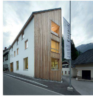
Die Fassade hat zwei Gesichter. | The facade has two faces.

Der dritte Preis geht an das Zentrum Rinka in Slowenien. Es baut den Ort weiter, fördert die Wirtschaft und informiert die Touristen. Ein Leuchtturm, der die Region überstrahlt.