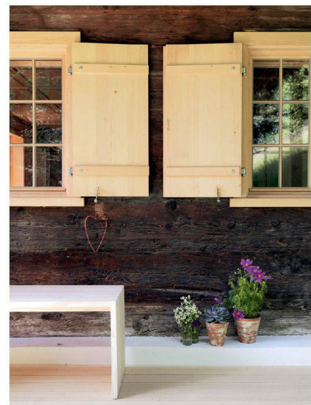
Die neuen Kastenfenster sind wie früher konstruiert. | The new windows are built the way they used to be.

“We must assume responsibility for the environment – and for building culture. This project does both very convincingly, yet introduces modern elements. The architect demonstrates great respect for history and rather than asking what is needed, he reflects on what is not required. This modesty is exceptional. The refurbishment is a hymn in praise of local craftsmanship and a consummate example of how to reduce energy consumption without hi-tech. It points the way forward for many of the old buildings in the Alps.”