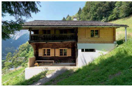
Alt und Neu ergänzen sich. | Old and new complement one another.