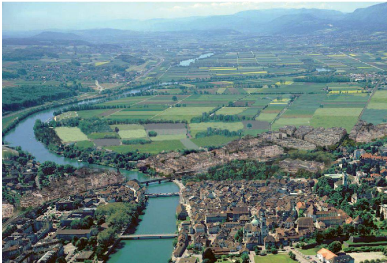
Beim «Masterplan» bleiben die Äcker und Wiesen im Westen der Stadt Solothurn grün.