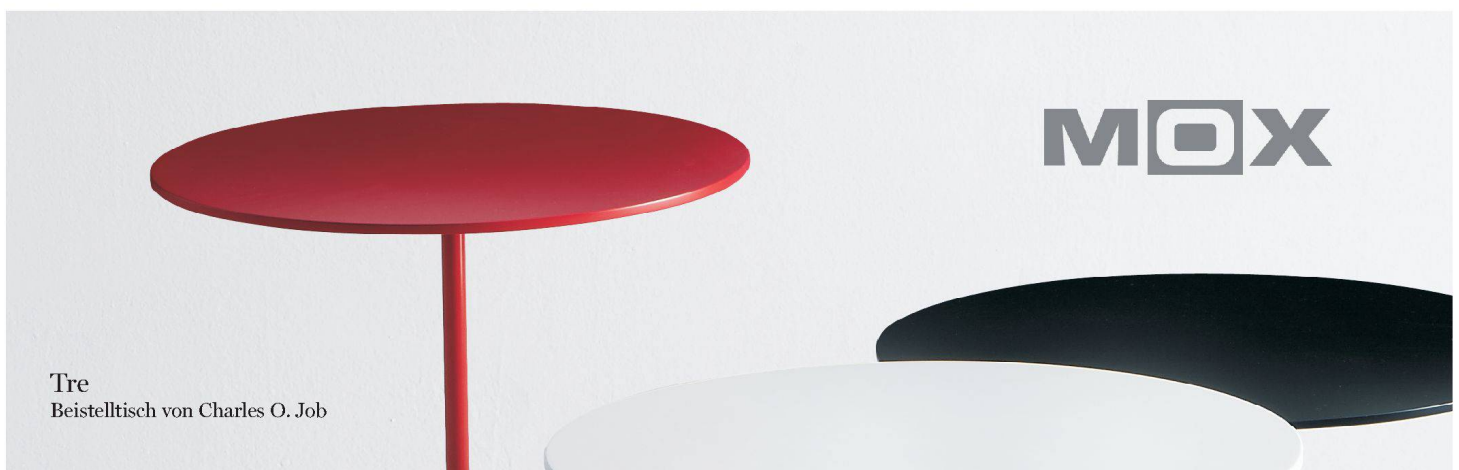
Tre Beistelltisch von Charles O. Job

Diese Details drängen sich nicht auf, aber bei genauer Betrachtung und vor allem im Gebrauch werden sie als Qualität spürbar. Trotz der im Namen steckenden Zweckbeschreibung handelt es sich um ein universelles Design. Nicht nur, weil wir uns hundert andere Szenarien für den Einsatz vorstellen können. Sondern auch, weil es als Teil eines Systems konzipiert wurde. So können die Bits mit dem magnetischen Adapter auch von grösseren Griffen aufgenommen werden. Und formal gliedert sich das kleine Set perfekt in die Werkzeugtypologie von PB Swiss Tools ein. Ausserdem überzeugen die Qualität der Verarbeitung und die ergonomische Durcharbeitung. Das könne nur mit einer konsequenten, selbstsicheren und vertrauensvollen Designarbeit erreicht werden, stellte die Jury fest. ●