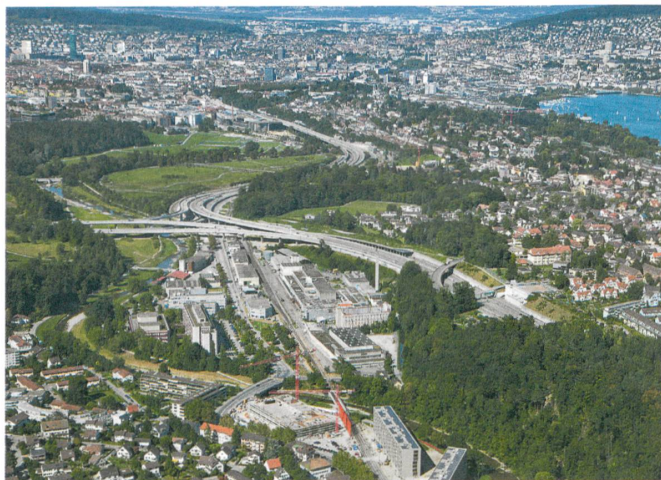
In die Stadt und zum See ist es nicht weit.

Das Gebiet liegt zwischen der Allmend und Zürich Leimbach im Sihltal. Es gehört zu Wollishofen, obwohl das vielen aus dem Quartier wohl gar nicht bewusst ist. Denn die Manegg gleicht einer Insel. Rundherum heben und senken sich bewaldete Hügelketten. Sie täuschen darüber hinweg, dass das Gebiet vom See nur rund einen Kilometer entfernt ist. Das linsenförmige Areal ist scharf abgetrennt von der Natur. Auf der einen Seite, im Westen, fliesst die Sihl, auf der anderen der Verkehr der Autobahn.