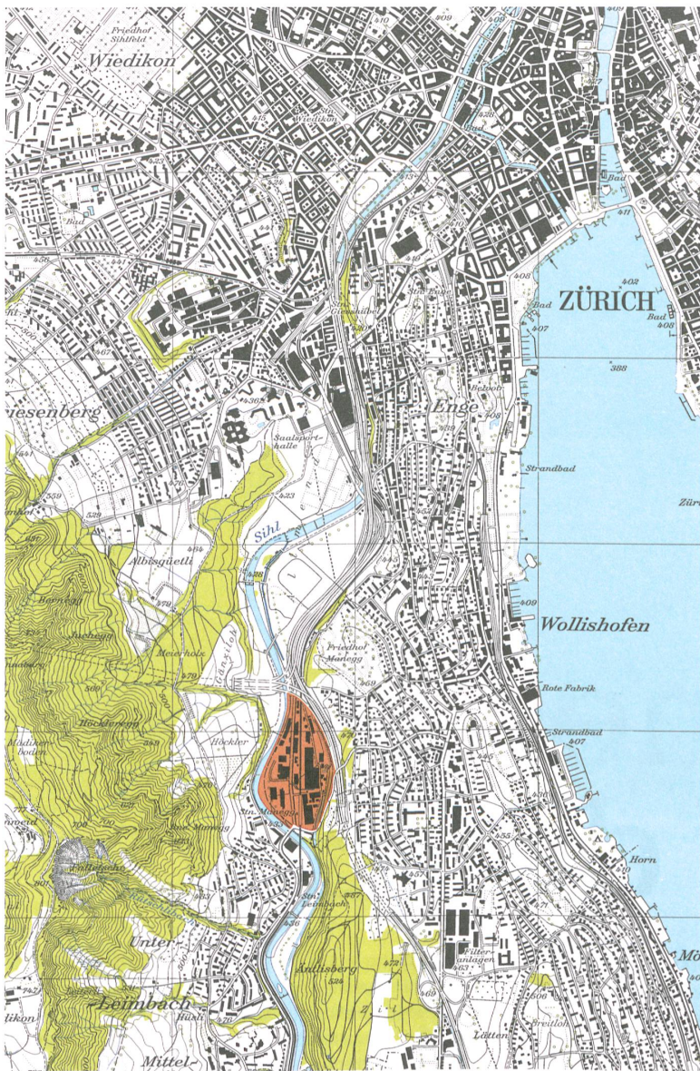
Die linsenförmige Manegg liegt zwischen Autobahn und Sihl.

grossen Hallen der ehemaligen Industrie prägen das Gebiet. Spaziergänger verirren sich kaum hierher. Alles ist umzäunt, abgesperrt, privat. Das wird sich ändern. Der unwirtliche Ort wird zu einem durchmischten Quartier. Die Industrie geht fort, Bewohner und Bürokräfte kommen an. Künftig sollen auf dem gesamten Manegg-Areal bis zu 1700 Personen wohnen und rund 5000 arbeiten. 2005 leitete die Stadt ein Quartierplanverfahren ein, das die Feinerschliessung und Eigentumsverhältnisse regelt.