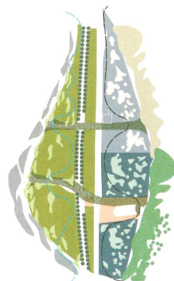
Unten prägt die Sihl die Natur, oben die Böschung des Entlisbergs.