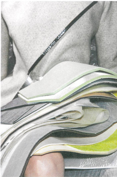
Das Modell «Opalite» kombiniert Loden und bondierten Schaumstoff.