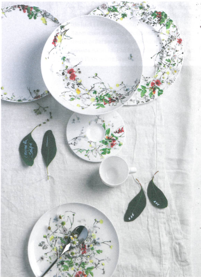
Regula Stüdlis Entwurf «Fleurs Sauvages» für die Porzellanmanufaktur Rosenthal. Foto: Rosen- thal GmbH, Germany