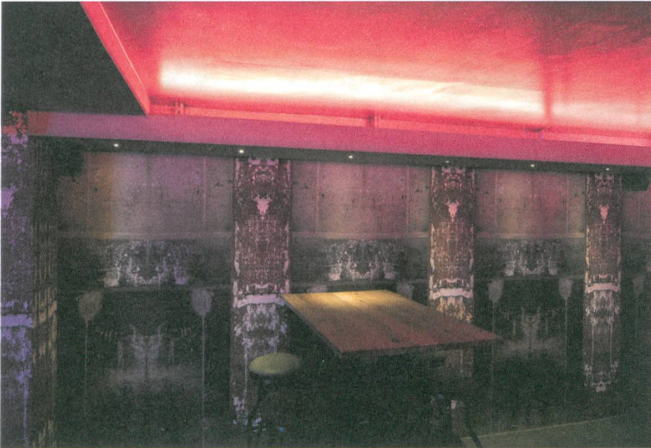
Die Tapete im Musikclub imitiert Wände in Industriebauten.