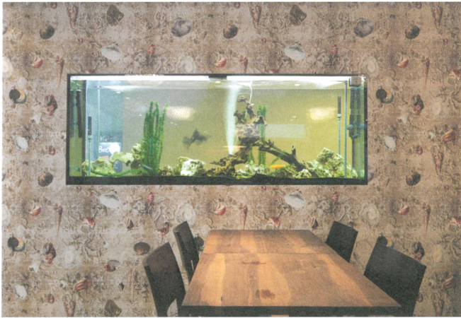
Die maritime Wandverkleidung fürs Restaurant Kalkan's in St. Gallen.