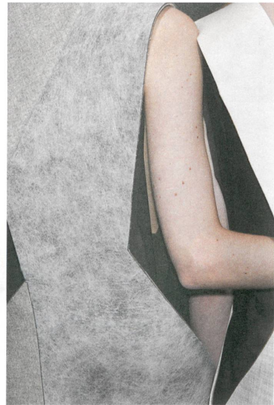
Die Mineralien Quarzit und Halit standen Pate.

→ Anders ist es mit Designs, die während der Anstellung entstanden sind: «Was hier in der Firma geschaffen wird, trägt unseren Namen, und auch die Rechte bleiben bei uns.» Lange war das bei Schlaepfer vertraglich nicht geregelt. Erst durch die neuen Medien ist es zum Thema geworden: Plötzlich hatten ehemalige Mitarbeiter ein Facebookprofil oder eine Website und veröffentlichten Entwürfe unter ihrem Namen.