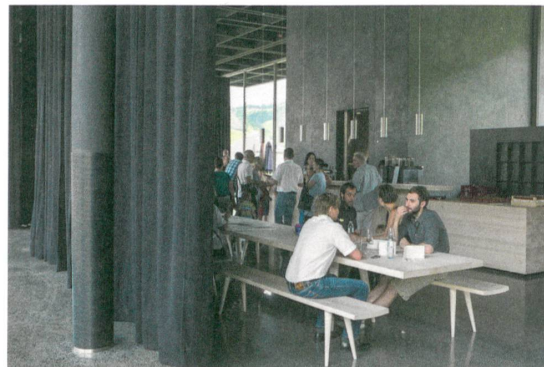
In der Werkraum-Wirtschaft treffen sich Handwerker, Kunden und Besucher an den langen Tischen.