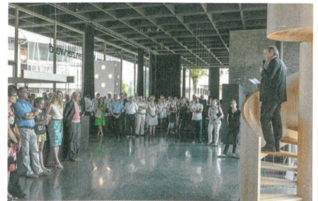
Kulturlandesrat Harald Sonderegger eröffnet die Ausstellung.