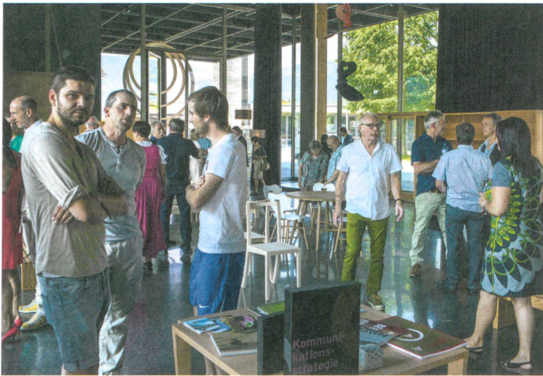
Werkraum-Mitglieder in der Diskussion.