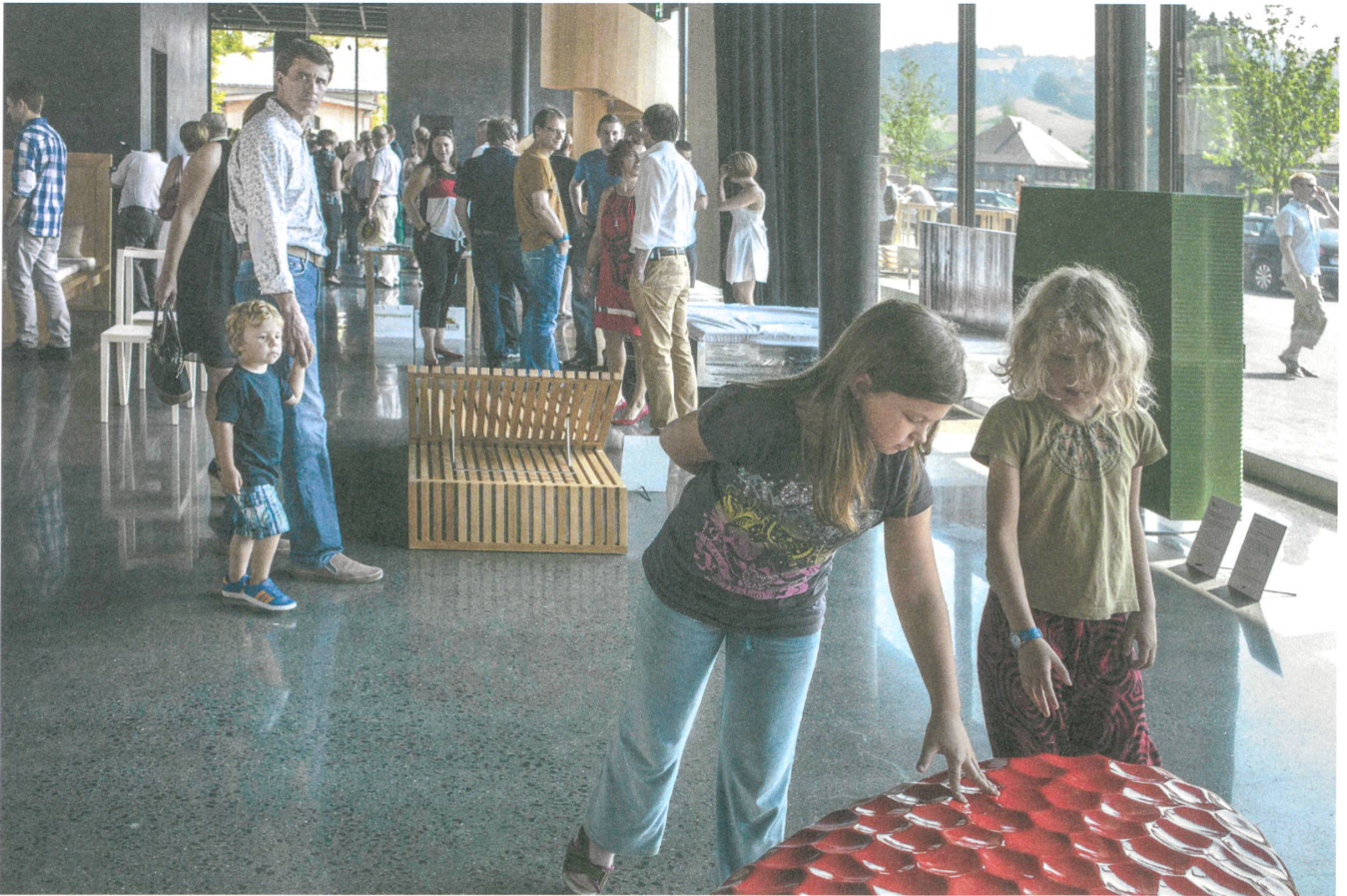
«Die Mitglieder stellen sich vor.» Eindrücke von der Eröffnungsausstellung.