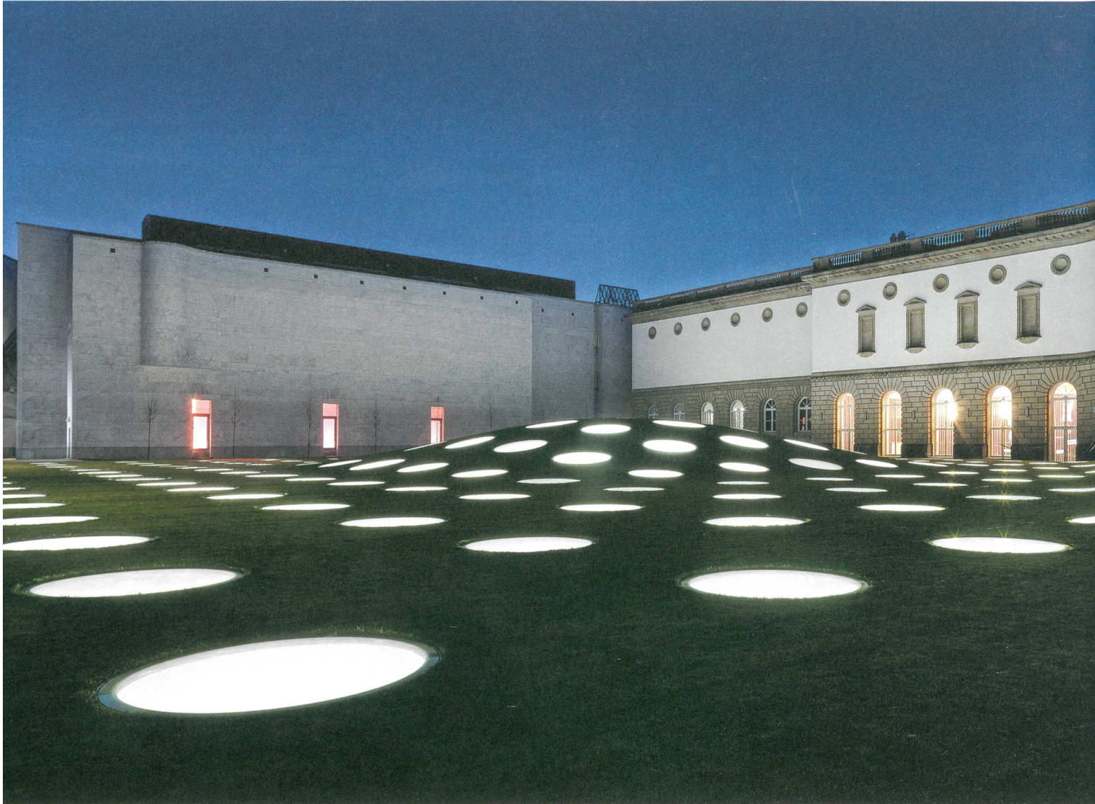
Städel Museum, Frankfurt/DE

„Licht und Architektur erfordern gerade in einem Museum ein Höchstmass an Harmonie, um den Besuchern einen uneingeschränkten Kunstgenuss zu gewährleisten und zugleich Exponate konservatorisch zu schonen. Durch die langjährige Partnerschaft mit Zumtobel konnten wir unser gemeinsames Wissen zur Realisierung eines einmaligen Museumsbau hervorragend kombinieren.“