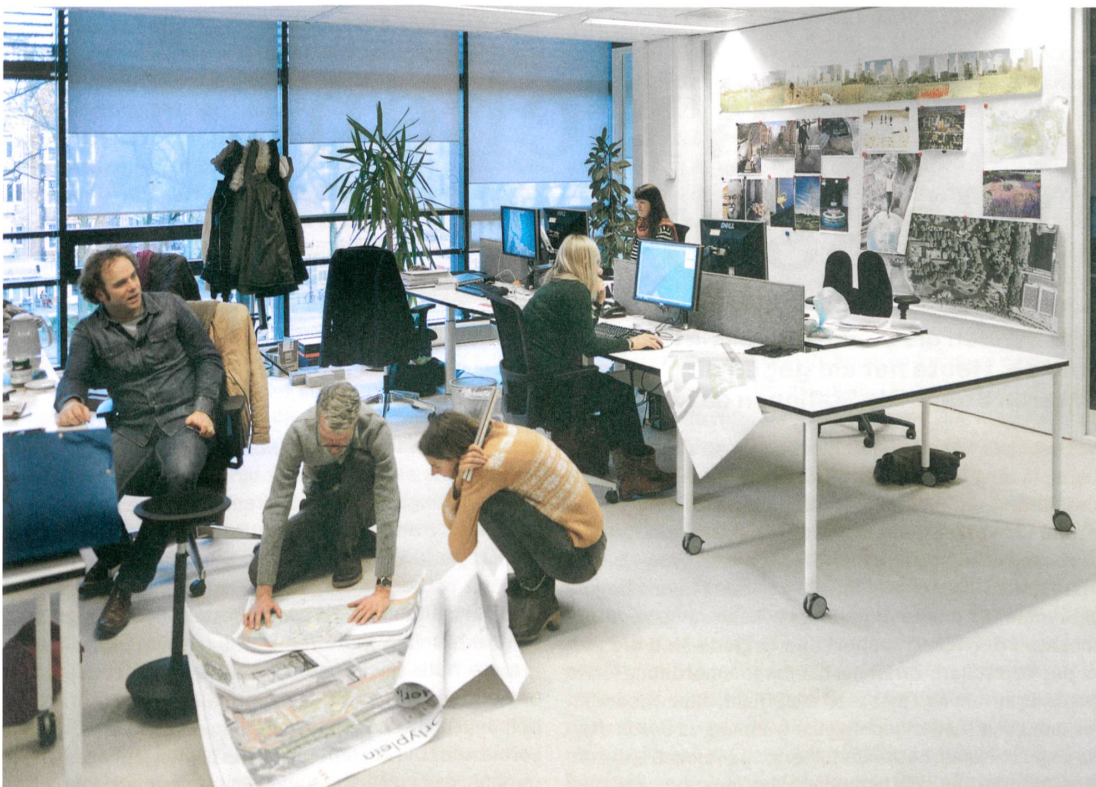
Im Dienst für Raumordnung gibts keine Sitzordnung. Alle suchen sich morgens einen Platz. | Bij de Dienst Ruimtelijke Ordening zijn er geen vaste werkplekken. Iedereen zoekt's ochtend een plaats.