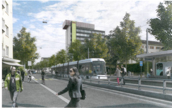
Wo genügend Platz ist, fährt die Bahn, begleitet von Baumreihen, auf eigenem Trasse. | Waar voldoende plaats is, rijdt de tram op een eigen tracé, tussen rijen bomen.