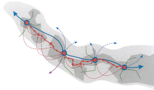
So wird der öffentliche Verkehr das Limmattal künftig erschlossen: | Zo zal het openbare verkeer het Limmattal in de toekomst ontsluiten: — Limmattalbahn; — S-Bahn; — Busse; — Regionalbahn.