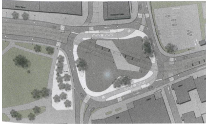
... und mitten auf dem neuen Stadt- platz halten. | ... en midden op het nieuwe stadspan stoppen.