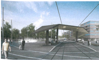
In Schlieren wird die Limmattalbahn durch das neue Zentrum fahren ... | In Schlieren zal de Limmattalbahn door het nieuwe centrum rijden ...