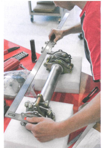
Genaueres Mass nehmen.

jekts. Bei Marengo in Pfäffikon ZH stiessen immer mehr Mitarbeitende zum Projekt, heute ist das Team auf mehr als achtzig Personen angewachsen. 2011 präsentierte Marengo ein Mock-up auf der Heli-Expo in den USA, der wichtigsten Messe für Helikopter – und sorgte für Aufsehen. Zwei Jahre später stand der Prototyp 1 dort, noch ganz roh. Aber er sendete ein klares Signal: «Wir machen das.» Geschickt spielt Marengo mit dem Label seiner Herkunft, preist den «Skye SH09» als «Swiss made», führt die Unterzeile «Swisshelicopter» im Unternehmensnamen und liess das Mock-up in den Landesfarben lackieren. Überhaupt prägen Rot und Weiss den Farbauftritt aller Marengo-Publikationen. «Die Wirkung ist enorm, Swiss steht für Qualität und Präzision», berichtet Stucki.