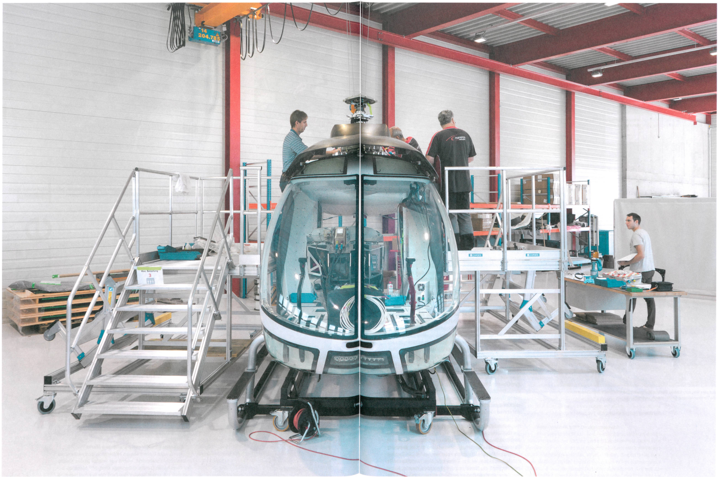
Das fest völlig gläserne Cockpit bietet dem Piloten gute Sicht auch nach unten. Ein markantes Plus, vor allem beim Transport von Aussenlasten.