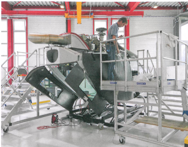
Zwei Türen im Heck erlauben den schnellen Zugang zur hohen Kabine mit durchgängig gleichem Bodenniveau.

Helikopter gehören in der Schweiz zum Alltag, sie transportieren Lasten und Menschen in den Bergen, überwachen den Verkehr oder sind in Notfällen schnell vor Ort. All dies ist vielleicht im kommenden, spätestens aber im übernächsten Jahr mit einem Modell «made in Switzerland» machbar. Dann soll der «Skye SH09» in die Serienfertigung gehen – ein Hubschrauber der 2½-Tonnen-Klasse, der flexibel nutzbar ist.