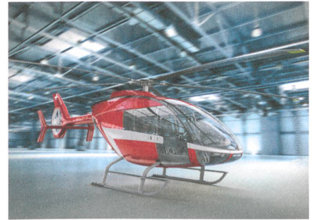
So wird er aussehen: Der «Skye SH09» soll 1,5 Tonnen zuladen oder bis zu 7 Passagiere mit Tempo 260 durch die Luft bewegen können. Visualisierung: Marengo