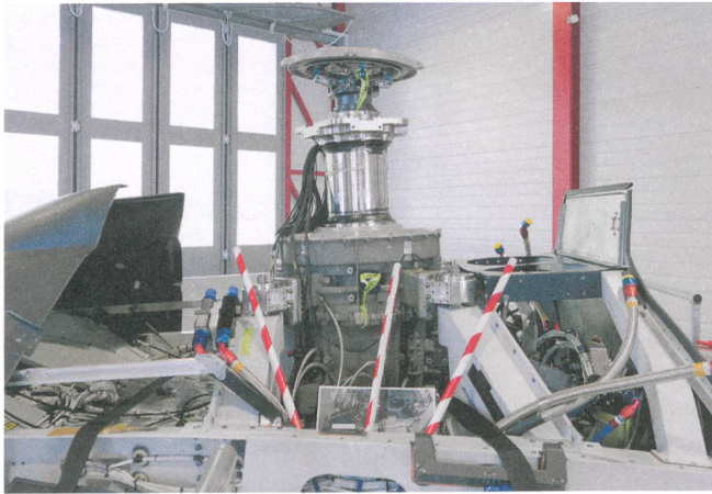
Hier wird der fünfblättrige, vibrationsoptimierte und gelenklose Rotor installiert. Dank der Verkleidungselemente ist der Antrieb einfach zugänglich.