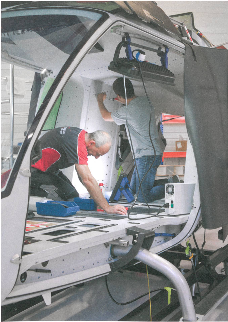
Die Türen an den Seiten und am Heck bieten optimale Zugänge. Avionik und Tank befinden sich in den vertikalen Boxen im Heckbereich.