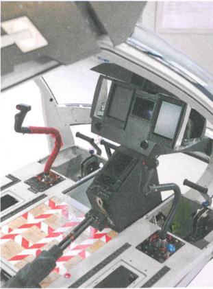
Noch fehlen die Sitze. Wie die Pedale sind sie ergonomisch verstellbar.