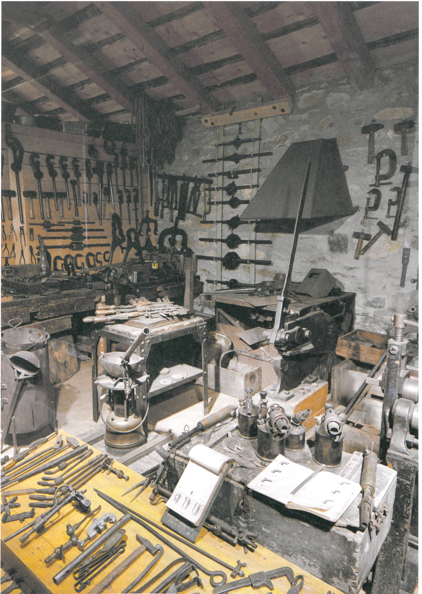
Das Gedächtnis des Handwerks ruht im Museum Regional in Illanz, einem lebhaften Museum der Arbeit.