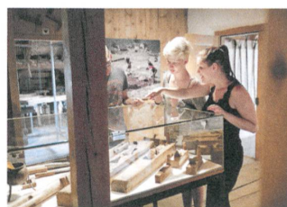
Das Museum Regional Surselva in Ilanz ist ein Zentrum für die Geschichte der Arbeit und des Alltags.

den Innenräumen, die uns mit dem Hauch der Geschichte, mit der verblassten Herrlichkeit des Ancien Régime und dem einstigen Luxus der Disentiser Fürststäbe umfassen.