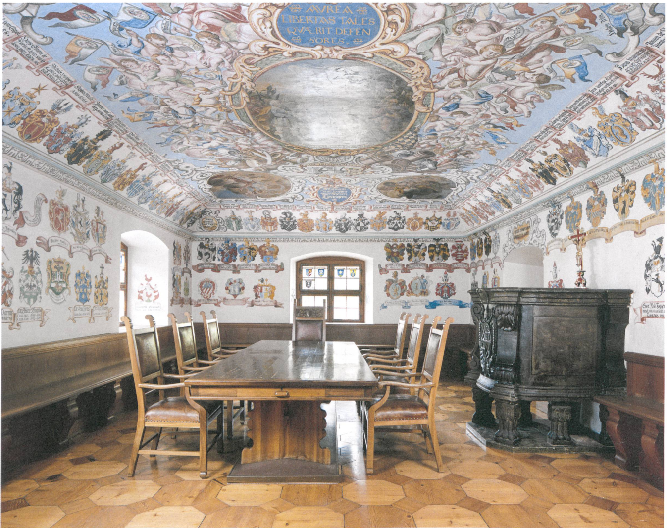
Der Landrichter-Saal in der Cuort Ligia Grischa von Trun: Macht- und Prachtentfaltung der Familien hoch oben im Gebirge, weit weg und doch nah den Zentren.

→ liess ihn 1674 bis 1679 der fürstlichste aller Disentiser Fürststäbte: Adalbert II. de Medell-Castelberg. Name und Wappen prangen am reichen Deckentäfer der Abtstube im zweiten Stock, wo sich auch der Landrichter-Saal befindet. Dort fällt zweierlei auf. Erstens die gewölbte Decke mit den Wappen und Namen aller Landrichter seit 1424. Zweitens: Dieselben Wappen wiederholen sich mit schöner Regelmässigkeit. Landsgemeinde hin oder her – der Graue Bund war eine Oligarchie.