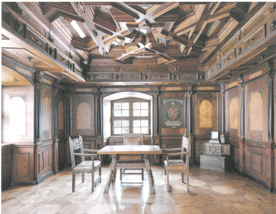
Museum des Regierens: Luxus und Herrlichkeit der Disentiser Fürststäbe in der Cuort Ligia Grischa.