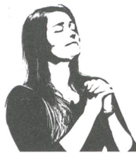
Out und erbaut

«Die Architekten begnügen sich zu sehr damit, Aufträge zu erfüllen. Sie verkennen, dass die Architektur zu viel mehr fähig ist, als Probleme zu lösen, nämlich Vorschläge zu entwickeln, wie das Leben aussehen könnte. Sie haben den Bereich der Visionen und Utopien verlassen.» ETH-Professor Philip Ursprung im Magazin des «Tages-Anzeigers» vom 6. September.