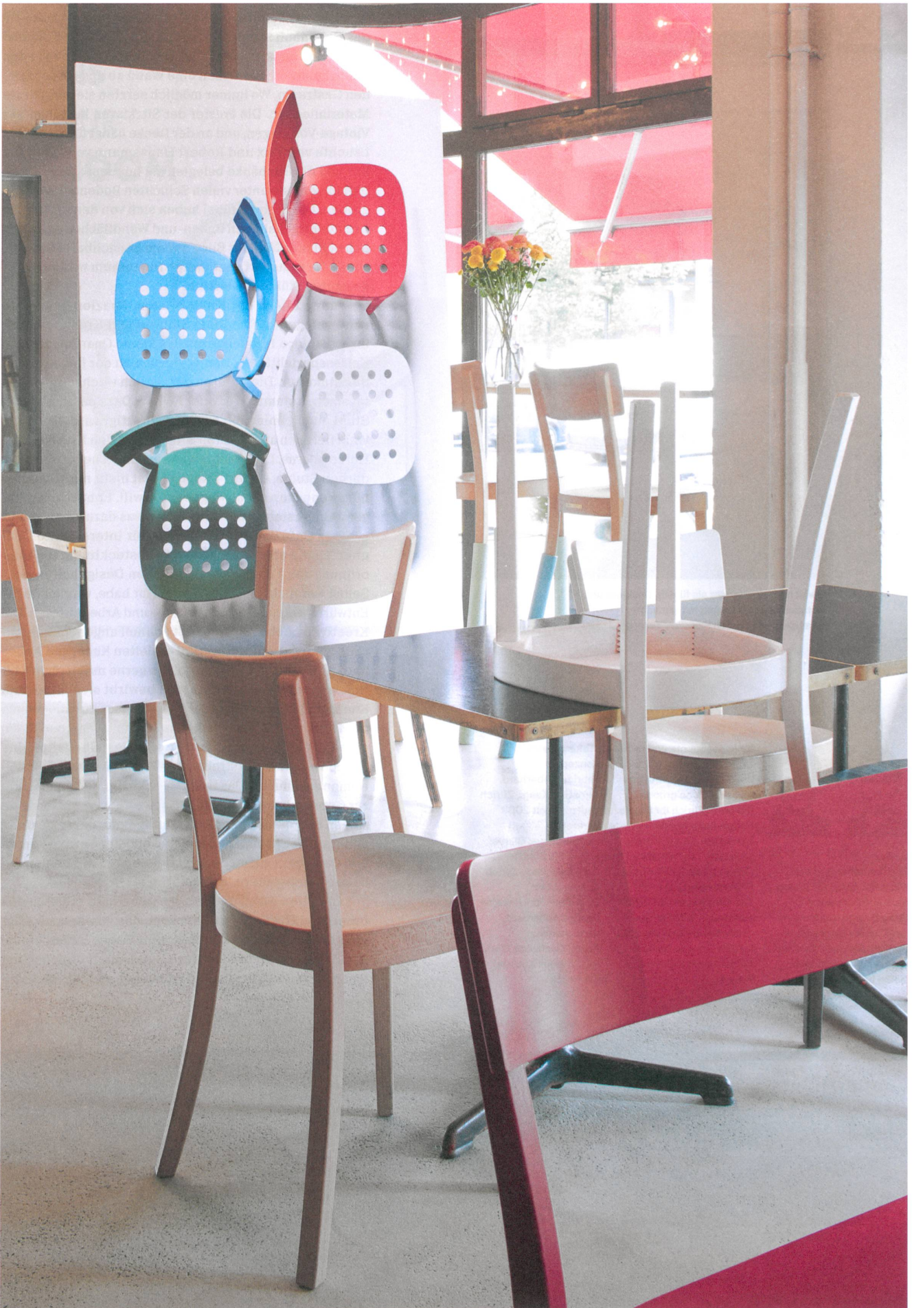
Der typische Beizenstuhl, der «Classic 1-380» von Horgenglarus, ist überaus wandelbar. Das beweisen die stets neuen Entwürfe, die das Café Z am Park möblieren.