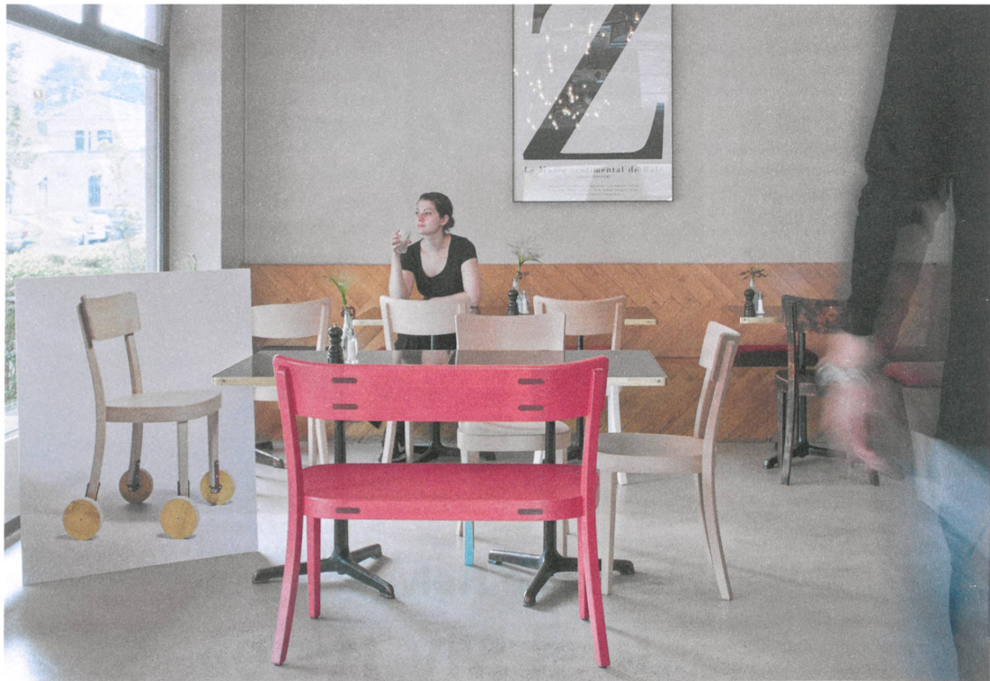
Die veränderten Stühle im Café Z am Park in Zürich kommen unter den Hammer. An den schrägen Auktionen lernt man die Designszene kennen.