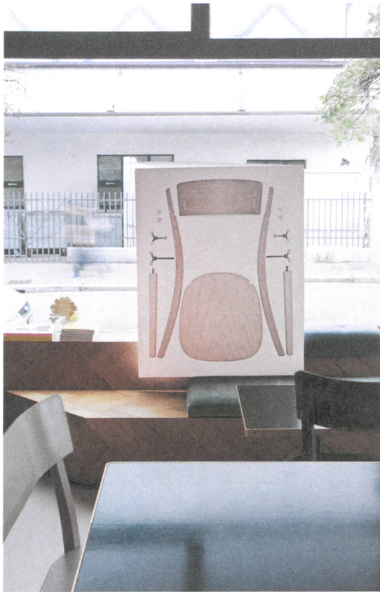
Inzwischen haben mehr als fünfzig Designer und Gestalterinnen am Projekt mitgemacht. Erstaunlich, wie sie den Klassiker dekonstruieren.