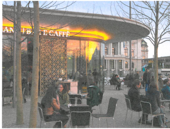
Das Café Collana an der einen Flanke des Platzes hat sich bereits zum Treffpunkt entwickelt.