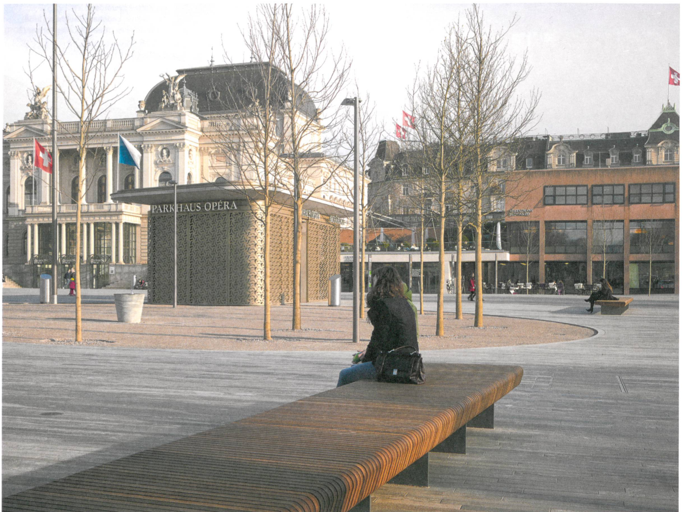
Eine lange Bank grenzt den Platz gegen das Utoquai ab. Im «Pavillon See» verbirgt sich neben dem Lift und der Treppe ins Parkhaus auch die archäologische Ausstellung mit Videos.