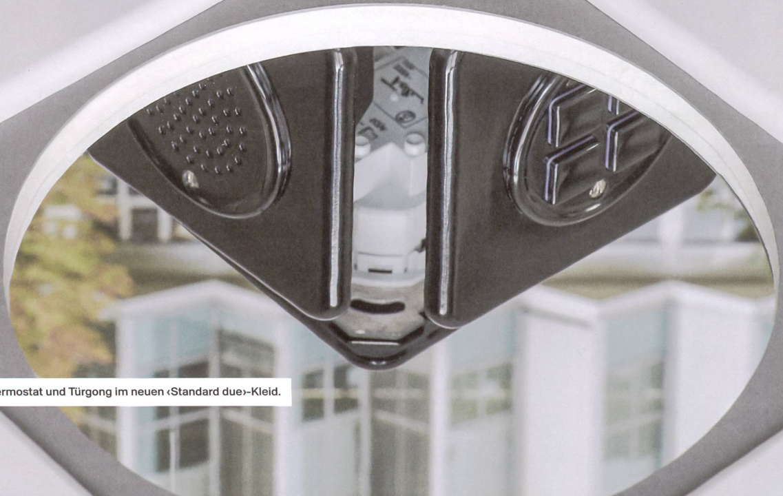
Schalter, Thermostat und Türgong im neuen «Standard due»-Kleid.