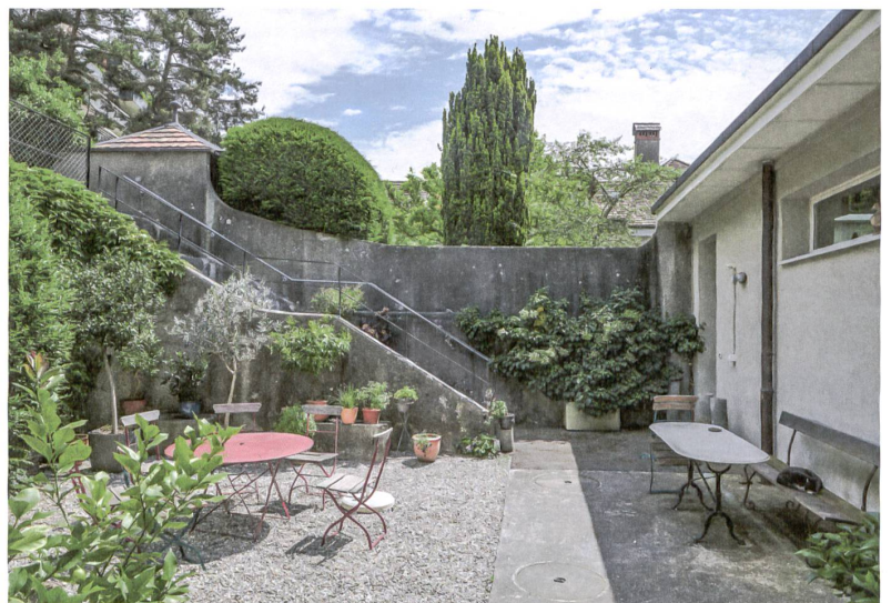
Zwei von etlichen Sitzplätzen für Gemeinschaft und Rückzug.