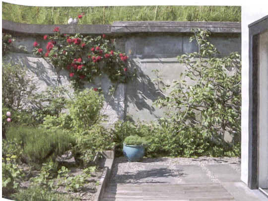
Der Garten bietet etwas Nahrung: Rhabarber, Kirschen, Küchenkräuter, seit Kurzem auch Beeren und Feigen.