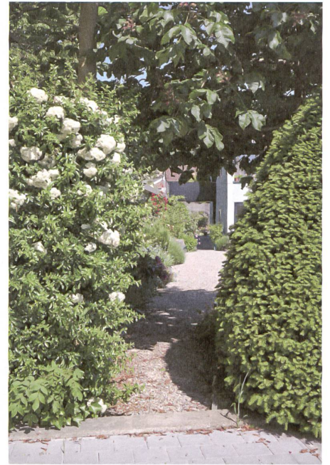
Vielfältige Düfte und Formen – Seitenzugang zum Hof.