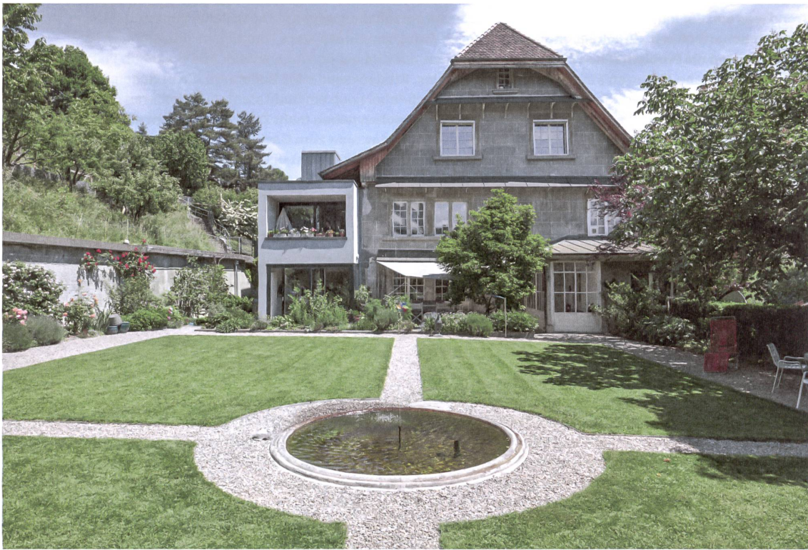
Beim Stürlerhaus in Bern ist der Hofcharakter bestimmend. Er bietet eine ruhige Gegenwart zur lärmigen Aussenwelt.