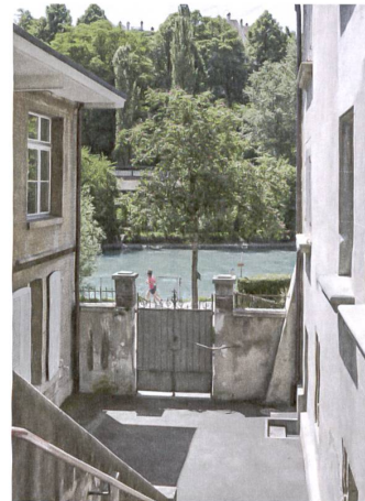
Durchblick zur Aare.