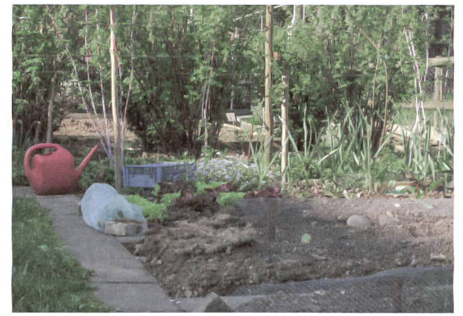
Johannisbeersträucher helfen, den Gartenraum zu gliedern.