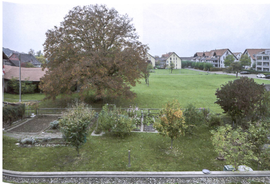
Typische Agglomerationssituation: Übergang von Landwirtschaft zu Siedlungsflächen.