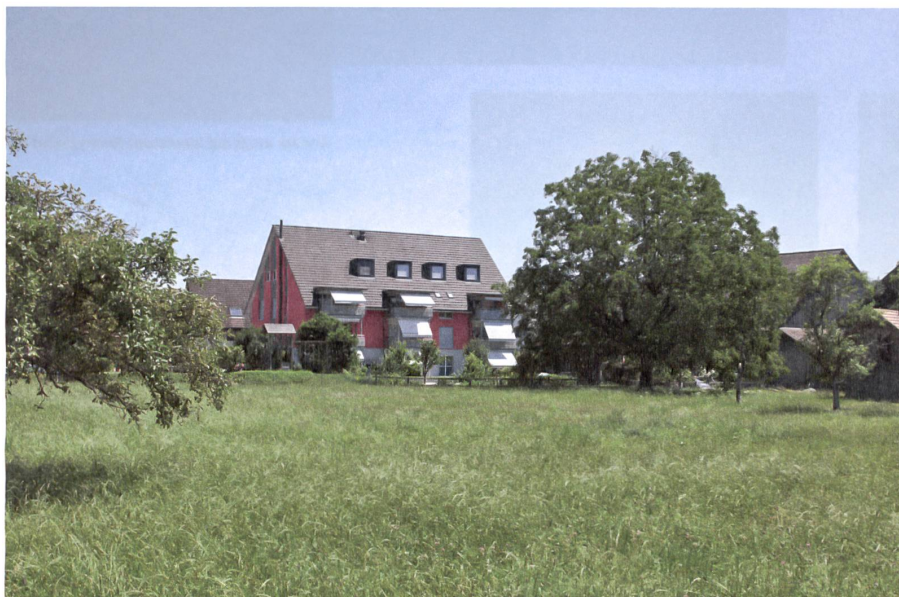
Zusammenspiel zwischen Häusern und ausgewachsenen Bäumen beim Alterswohnprojekt in Kloten.