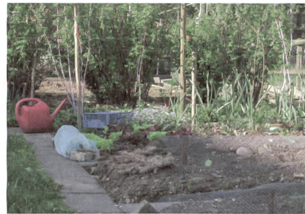
Johannisbeersträucher helfen, den Gartenraum zu gliedern.