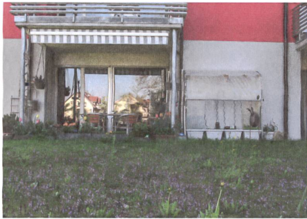
Bewohner versuchen, den harten Übergang zwischen Haus und Aussenraum aufzuweichen.