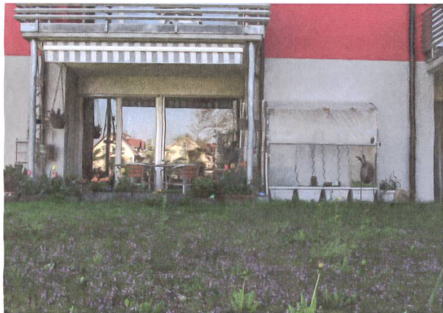
Bewohner versuchen, den harten Übergang zwischen Haus und Aussenraum aufzuweichen.