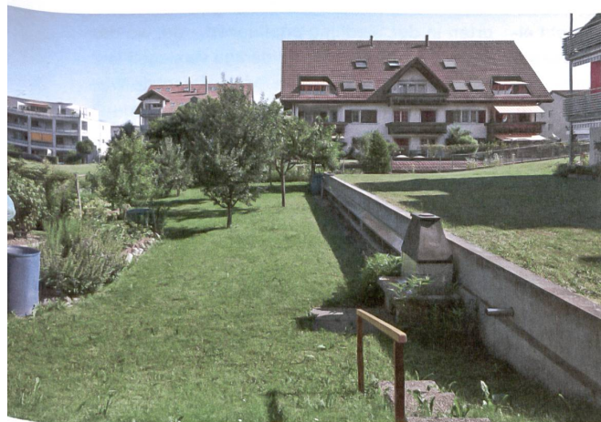
Mit einer anmutenden Bepflanzung liess sich die scharfe Kante der Tiefgaragenbegrenzung als Attraktion gestalten.