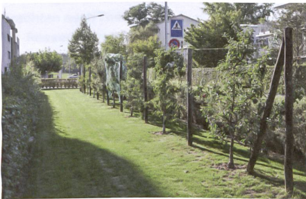
Spalierobst an der Strassenseite.