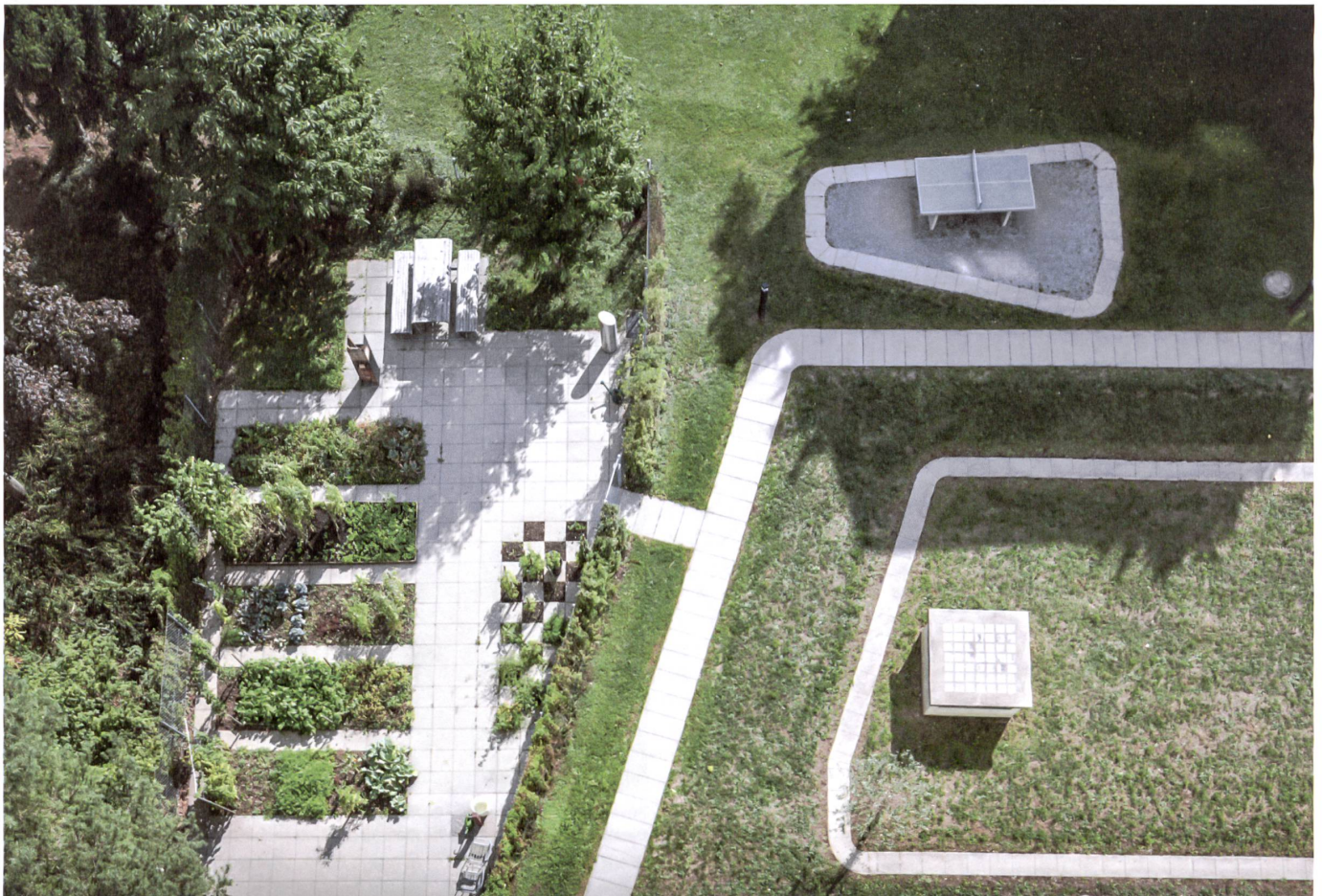
Der neue Pflanzplatz ist zum wichtigen Treffpunkt für Erwachsene und Kinder geworden, der Pingpontonisch und die weiten Wiesenflächen laden Jugendliche ein.