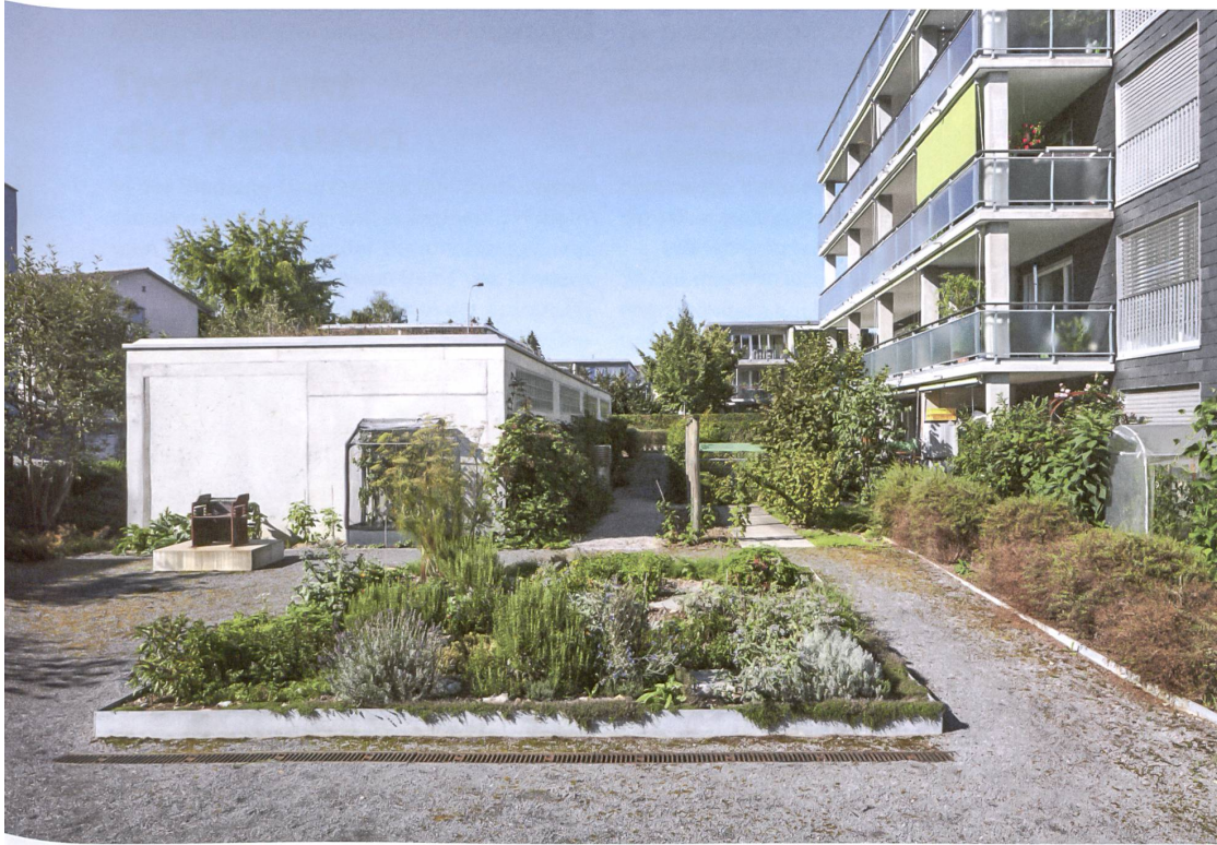
Das Kräuterbeet im Zentrum des Altersgartens liesse sich als Hochbeet bequemer bewirtschaften.