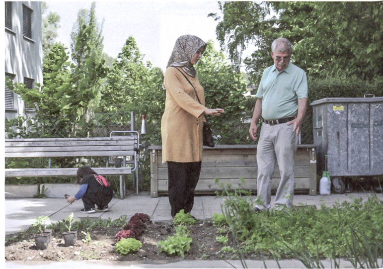
Austausch über Pflanzen und das Gärtnern in der Siedlung Glanzenberg in Dietikon.