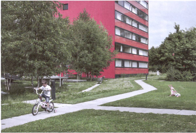
Grosszügige Wege durch das weite Gelände sind Kindervelotauglich und ermöglichen Rundgänge auch mit dem Rollator.