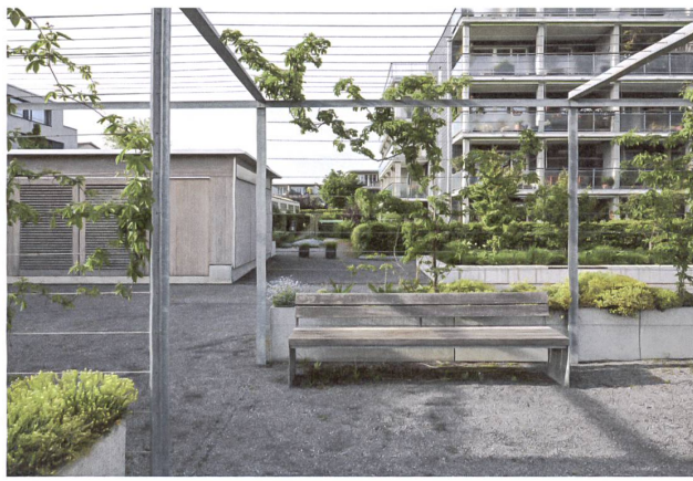
Hinter dem Gartenpavillon beginnt der klar abgetrennte Altersgarten.