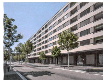
27 «Hof Lilienthal»