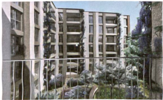
30 «Amelia», Visualisierung

Der städtische Block bestehend aus zwei angesetzten Baukörpern mit je einem individuellen Innenhof enthält gegen die Thurgauerstrasse Büros und gegen den Boulevard Lillienthal Wohnungen, die sich um den grösseren Innenhof anordnen und erschliessen. Adresse: Thurgauerstrasse 156, Boulevard Lillienthal 12/20 Bauherrschafft: Credit Suisse 1a Immo PK, Zürich Auftragsart: Eigenentwicklung der Steiner AG mit vorgeschaltetem Wettbewerb, TU Werkvertrag. Entwicklung bis Baubewilligung und Verkauf: Steiner AG, Zürich Architektur: Stücheli Architekten, Zürich Generalunternehmung: Steiner AG, Zürich Kosten: Fr. 150 Mio.