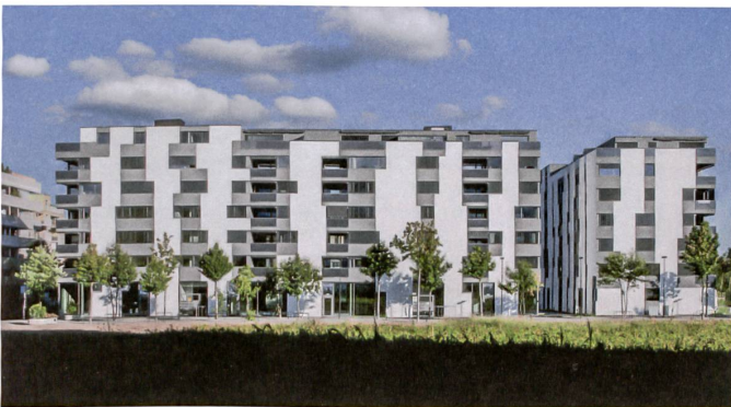
13 «Chavez Verde»