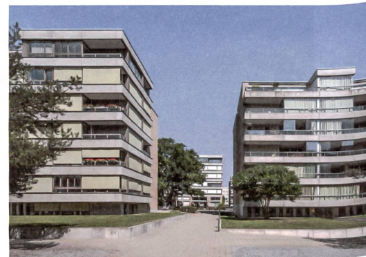
4-6 «Wohnen am See», «Seeblick» und «Frontwave» v.l.n.r.