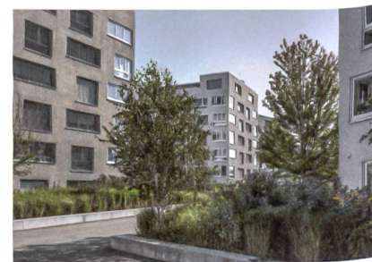
9 Wohnsiedlung «Glattbach»