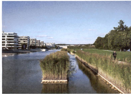
3 Opfikerpark

Gleichzeitig mit den ersten Gebäuden entstand im Glattpark der Opfikerpark samt Glattparksee. Die Landschaftsarchitekten haben eine geometrische Anlage entworfen. Das stadtseitige Ufer des Sees bietet einen Sandstrand, das gegenüberliegenden Ufer Rasenflächen. Der Park ist das wichtigste Element und stiftet Quartieridentität.