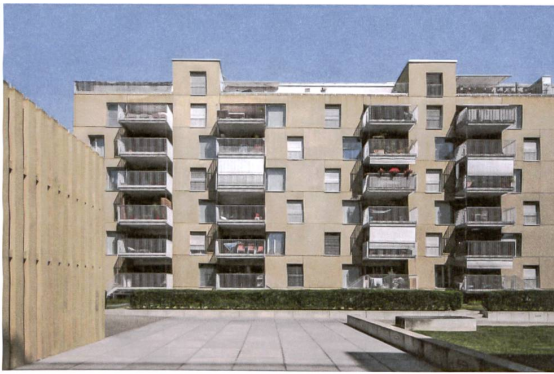
10 Überbauung «Lilienthal»

gemeinsam durchgeführten Studienauftrag erreicht, den das Architekturbüro von Ballmoos Krucker für sich entscheiden konnte.