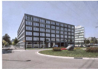
18 Geschäftshaus «Lilienthal»

Adresse: Boulevard Lilienthal 2–8 Bauherrschaft: Allreal Generalunternehmung, Zürich Architektur: MOKArchitecture, Zürich Kosten: Fr. 57 Mio.