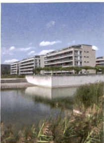
14-16 «An der Promenade», «Seepark Glattpark» und «Lematt» v.r.n.l.