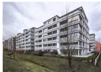
8 Wohnüberbauung «Lago»