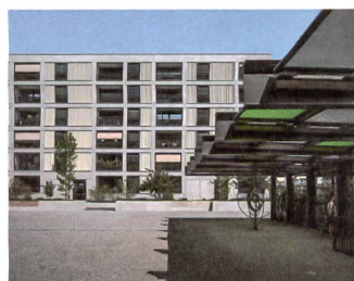
26 Glattpark Mitte