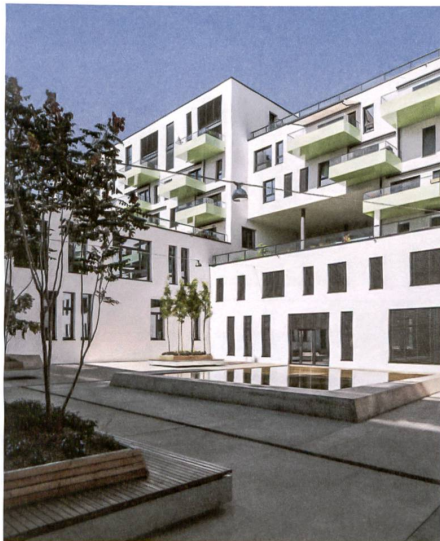
17 «Wright Place»