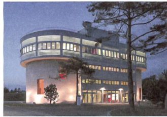
1 ARA Glatt, «Bilden + Begegnen»

Seit 2001 wird das Abwasser von Zürich Nord in dieser Kläranlage nicht mehr gereinigt, sondern nur noch gesammelt und durch einen Stollen in die Anlage Werdhölzli geleitet. Die Gebäude hat man zu einem Seminarzentrum umgebaut. Adresse: Orionstrasse 165 Bauherrschaft: Stadt Zürich, ERZ Architektur: Schockguyan Architekten, Zürich Kosten: Fr. 10,8 Mio.