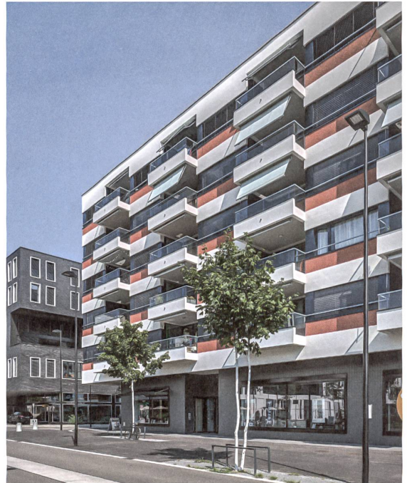
20, 21 «Wright House»

In diesem markanten, mit Klinkerplättchen verkleideten Haus, sind 52 Eigentumswohnungen untergebracht. Vorspringende