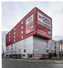
7 «Myplace Selfstorage»

Die 15 teilweise zusammengebauten Häuser der Überbauungen «Wohnen am See», «Seeblick» und «Frontwave» waren die ersten Wohnbauten im Glattpark. Charakteristisch sind die grauen Betonbänder und das Sichtmauerwerk der Fassaden. Trotz der unterschiedlichen Bauherrschaften bilden sie eine starke Einheit. Diese wurde durch den 2002 von den beteiligten Grundeigentümern