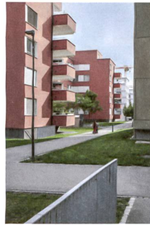
12 «Dreisicht»