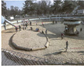
29 Spielraum ARA Glatt

Das Büro- und Gewerbehause steht auf dem Perimeter der dritten Etappe des Glattparks. Die gefalteten Blechelemente verleihen der Fassade eine Plastizität und erzeugen perspektivische Effekte. Adresse: Glattparkstrasse 3 Bauherrschafft: H113, Baden Architektur: Fischer Architekten, Zürich