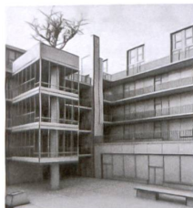
32 «Min Max», Modell

26 Glattpark Mitte, 2015 Der u-förmige Baukörper öffnet sich gegen den ruhigen Hof. An der Fassade bilden Sichtbetonelemente einen Raster, der verglast oder mit gefaltetem Streckmetall gefüllt ist. Die 110 Mietwohnungen sind vom Hof her erschlossen. Adresse: Boulevard Lillienthal 31–45 Bauherrschafft: Ant. Bonomo's Erben Immobilien, Zürich Architektur: Think Architecture, Zürich Landschaftsarchitektur: Rosenmayr Landschaftsarchitektur, Zürich Generalunternehmung: C. Vanoli Generalunternehmung, Immensee Kosten: Fr. 35 Mio. (BKP 2) Auftragsart: Studienauftrag