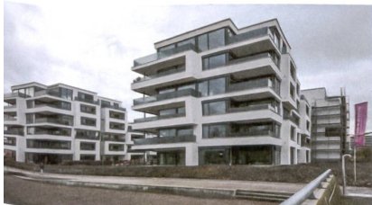
31 «Hamilton View»

25 Hotel «Kameha Grand Zürich», 2015 Das siebengeschossige Hotel steht an der Strasse von Oerlikon zum Flughafen. Horizontale Metalllamellen gliedern die Glasfassade gleichmässig in Streifen. Dahinter liegen 245 Zimmer, Kongress- und Konferenzräume sowie Bars und mehrere Restaurants. Adresse: Dufaux-Strasse 1 Bauherrschafft: Turintra AG, vertreten durch UBS Fund Management (Switzerland) AG, Basel Projektentwickler: Mettler2Invest, Zürich Architektur: Tec Architecture Swiss, Ermatingen Landschaftsarchitektur: Nipkow Landschaftsarchitektur, Zürich