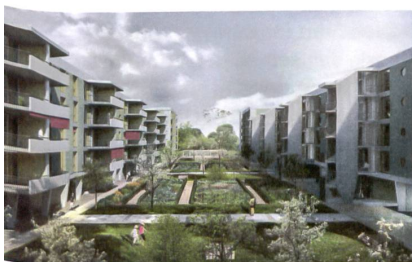
34 «Siedlung Glattpark», Visualisierung

27 «Hof Lillienthal», 2015 Die 149 Wohnungen orientieren sich gegen einen grossen, gärtnerisch gestalteten Hof. Am Boulevard kragt der Baukörper aus und bildet eine Zone vor den Laden- und Gewerbeflächen. Adresse: Dufaux-Strasse 47–81 Bauherrschafft: Früh Immobilien, Wallisellen; W. Schmid & Co., Opfikon Architektur: René Schmid Architekten, Zürich; W. Schmid, Opfikon (Ausführungsplanung)