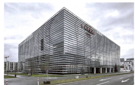
25 Hotel «Kameha Grand Zürich»