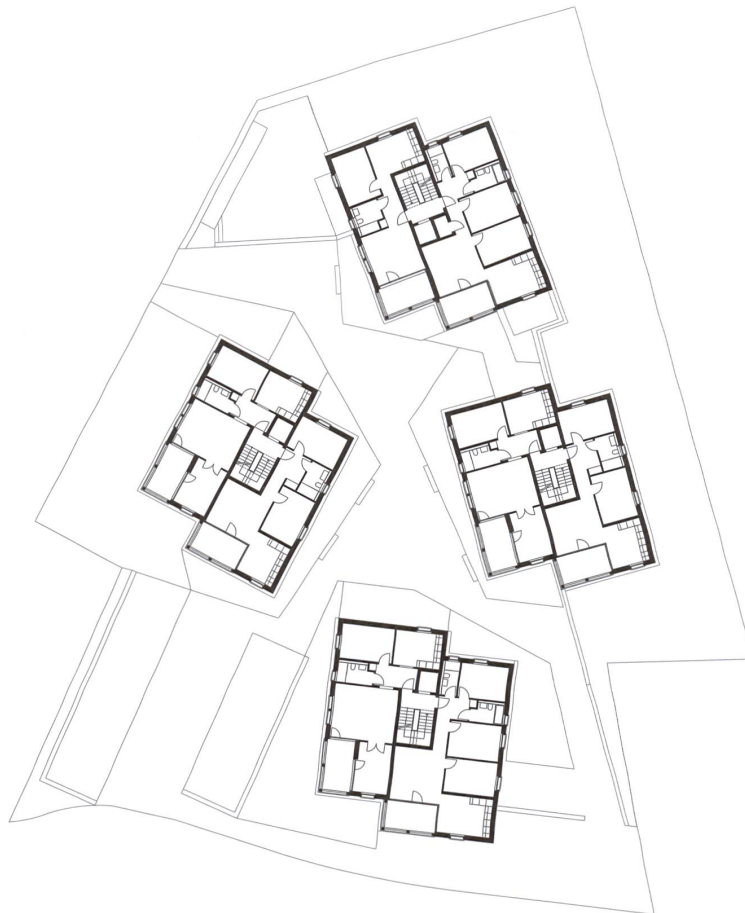
Grundriss Regelgeschoss und Umgebungsplan mit der Piazzetta im Zentrum der Neubauten.