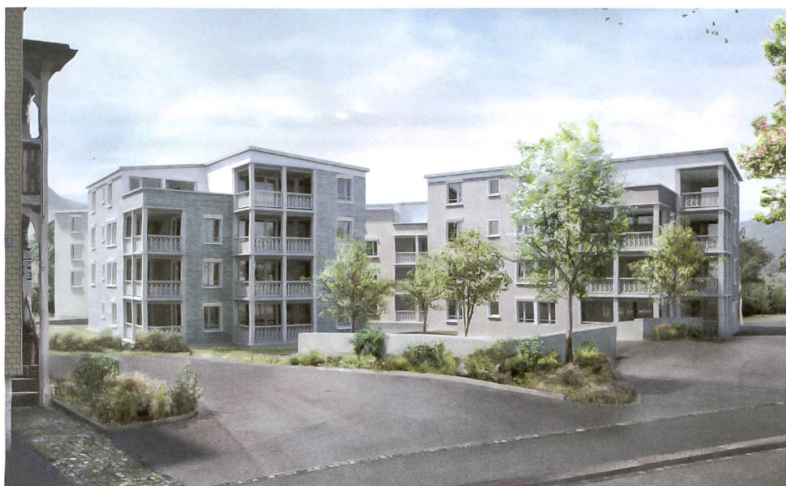
Die Überbauung besteht aus einem Ensemble von vier ähnlichen Wohnhäusern.

von Deon Architekten, Luzern, reagiert mit vier plastisch geformten Baukörpern besonders gut auf die Körnigkeit der Bebauung in der Umgebung. Eine Sequenz von Plätzen mit unterschiedlicher Stimmung verbindet die bestehenden Wege, leitet die Fussgänger bis zur Kirche und wird der zentralen Lage im Dorf gerecht. Der grosszügige Zugangplatz, auf dem, wie bei historischen Stadt- oder Dorfkernen, die Besucherparkplätze unter Baumkronen angeordnet sind, öffnet sich zur Wassergasse. Ein bemerkenswerter Aspekt ergibt sich durch Einschnitte in die Dachflächen. Diese wurden nötig, um die erlaubte bauliche Dichte einzuhalten. Die so entstehenden Dachterrassen sind nicht etwa exklusiven Penthouses zugeordnet, sondern je zwei kleinen Wohnungen.