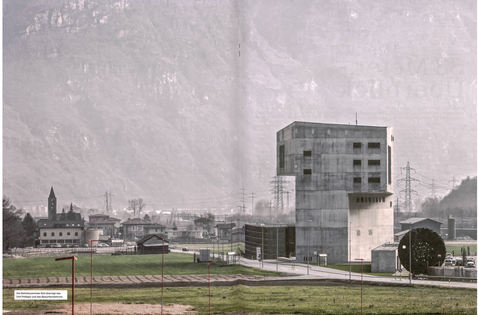
Die Betriebszentrale Süd überragt das Dorf Pollegio und das Besucherzentrum.