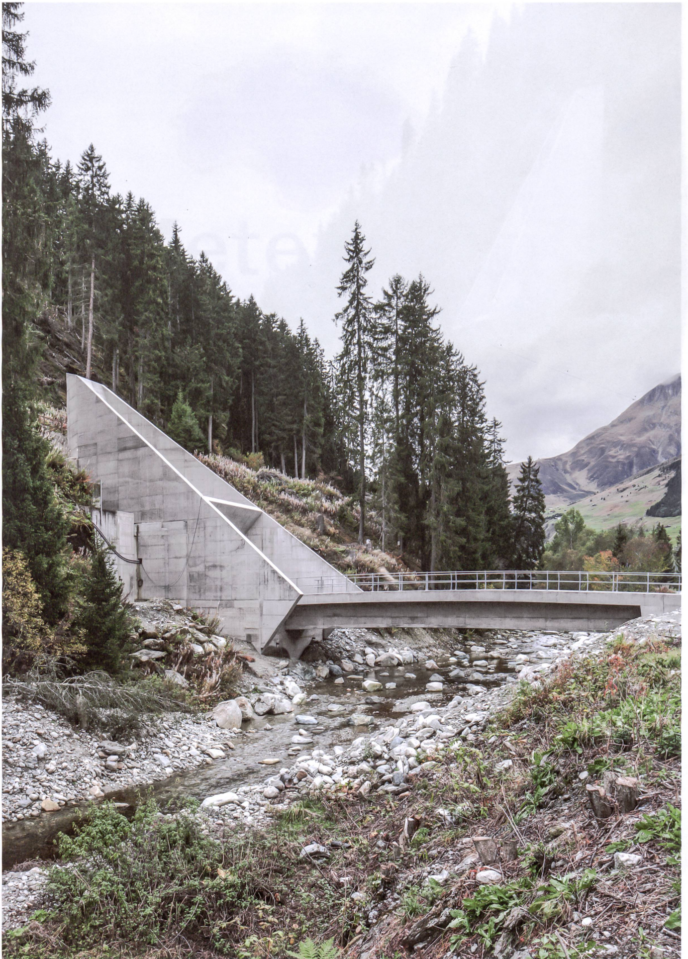
Multifunktionale Zufahrt: Das Portalbauwerk bei Sedrun verbindet Zuluftkanal, Lawinenschutz und Zufahrt zu den 800 Meter tiefen Schächten im Berginneren.