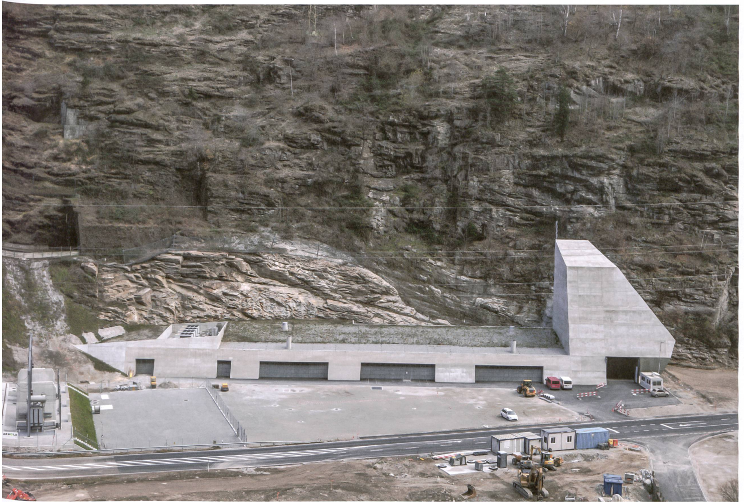
Körperhafte Stützmauer: Das Mehrzweckgebäude in Faido vereint Unterwerkgebäude, Bahn-technik, Lüftungszentrale und Eingänge zu Sondier- und Zugangsstollen in einem 120 Meter langen Bau am Hangfuss.

→ Eingang des Sondierbohrungsstollens geplante Technikgebäude zurück. Und siehe da: Auch die Lüftungszentrale des Zwischenangriffs Faido wurde schliesslich grösser als angenommen, und unmittelbar nebenan planten die SBB ein Unterwerk mitsamt Gebäude, um Starkstrom in Bahnstrom umzuwandeln.