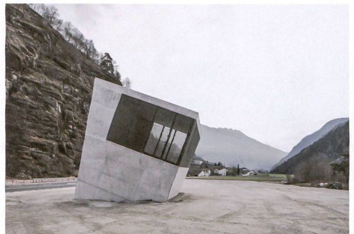
Um ein Wiederansaugen von Abluft zu verhindern, stösst der Zuluftkanal separat an die Oberfläche.

Die aerodynamisch logische Schräge setzt sich als gestalterisches Motiv über die gesamte Front des Betontiers fort und knickt bei seinem Kopf zweifach in die Gegenrichtung. Als funktional aufgeladene Stützmauer findet es einen kräftigen Abschluss. Es ist mehr Haus- als Kunstbau und wirkt zugleich körperhafter als die an Faltwerke erinnernden Zu- und Abluftbauten in Sedrun oder als die Tunnelportale. Aus den verschiedenen Anforderungen werden eigenständige, doch vergleichbar polygonale und dynamische Betonarchitekturen. ●