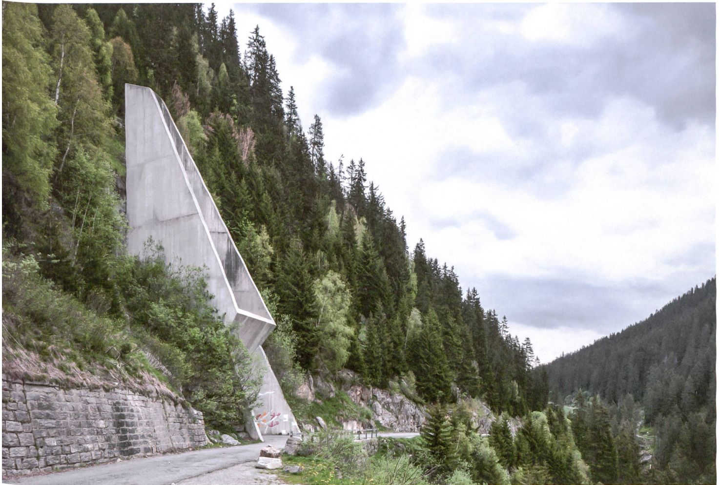
Integrative Form: Der Entlüftungsbau in Sedrun vereint Abluft, Lawinenschutz, Zugang und Wendepunkt.