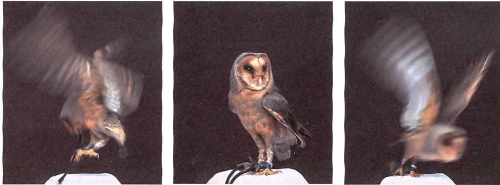
«the bird», drei Video- stills aus der Installation von Ursula Palla.